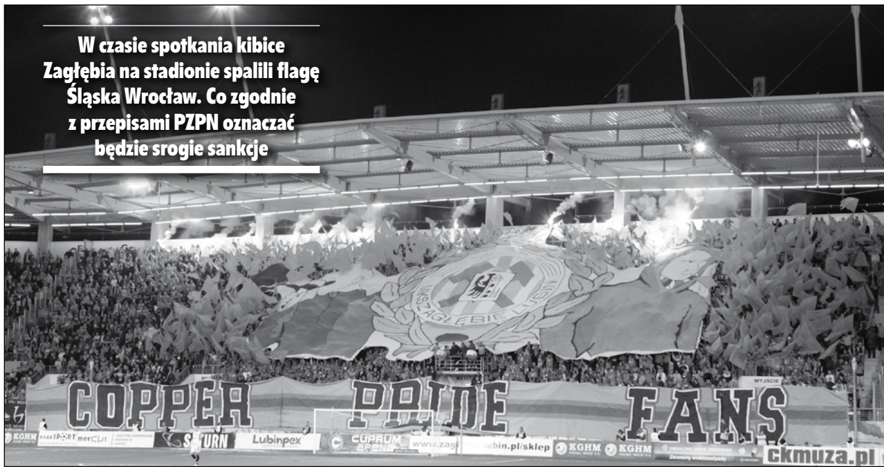
W czasie spotkania kibice Zagłębia na stadionie spalili flagę Śląska Wrocław. Co zgodnie z przepisami PZPN oznaczać będzie srogie sankcje

– Kibice Śląska Wrocław dojeżdżając na lubiński stadion dążyli do konfrontacji, wybijali szyby w samochodach, ła-