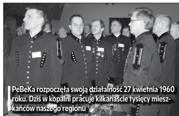
PeBeKa rozpoczęła swoją działalność 27 kwietnia 1960 roku. Dziś w kopalni pracuje kilkanaście tysięcy mieszkańców naszego regionu

– Mogę o sobie powiedzieć, że jestem jedną z osób, która niejako budowała tę firmę, a jedno-