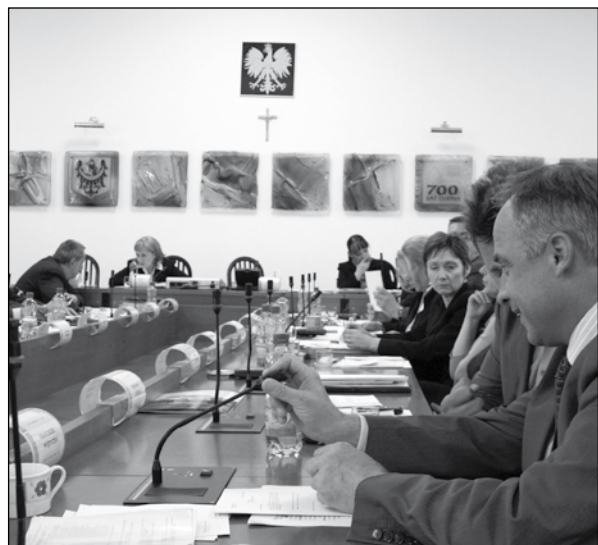
■ Jedenastu radnych poparło uchwałę, tyłu samo było przeciwko