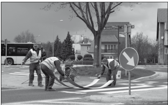
Malowanie oznaczeń na miejskich drogach gminnych odbywa się tylko w nocy. Tych prac nikt nie skonsultował z lubińskim magistratem