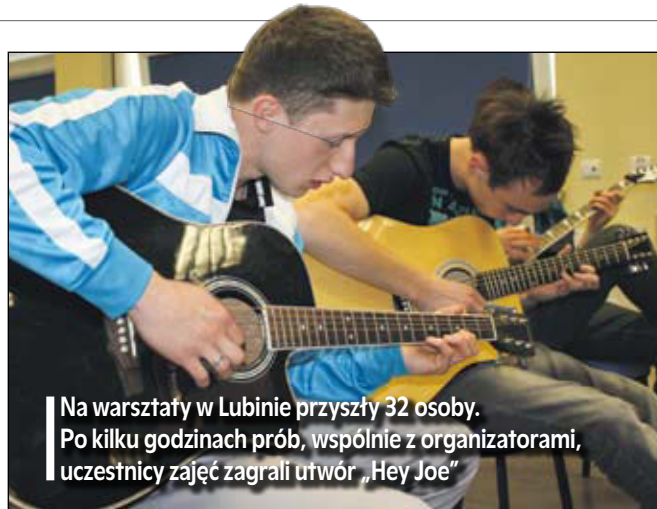
Na warsztaty w Lubinie przyszły 32 osoby. Po kilku godzinach prób, wspólnie z organizatorami, uczestnicy zajęć zagraли utwór „Hey Joe”

Wszyscy uczestnicy warsztatów otrzymali pamiątkowe koszulki i certyfikaty. Wszyscy też za-