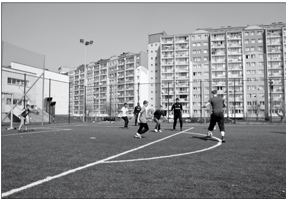
Orlik powstał przy Zespole Szkół nr 2. W czasie zajęć lekcyjnych obiekt służy uczniom szkoły, popołudniami miał być dostępny dla mieszkańców osiedla

– Ja jestem jak najbardziej za tym, żeby boisko było dostępne dla mieszkańców, bo przecież takie były założenia tego projektu – przyznaje dyrektor Szagała. – Jednak musimy być też dostępni dla grup zorganizowanych, które proszą nas o możliwość przeprowadzania treningów. Staramy się tak roz-