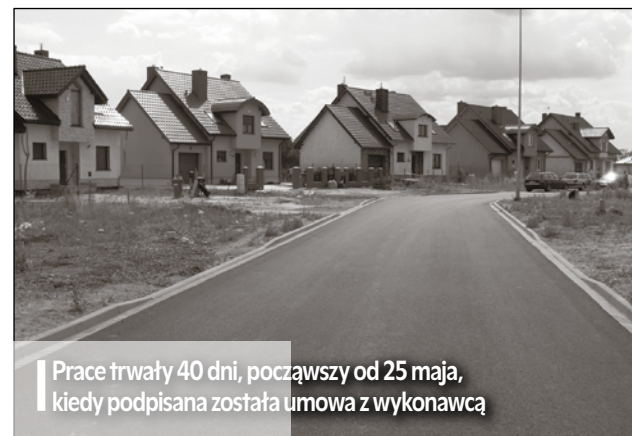
■ Prace trwały 40 dni, począwszy od 25 maja, kiedy podpisana została umowa z wykonawcą