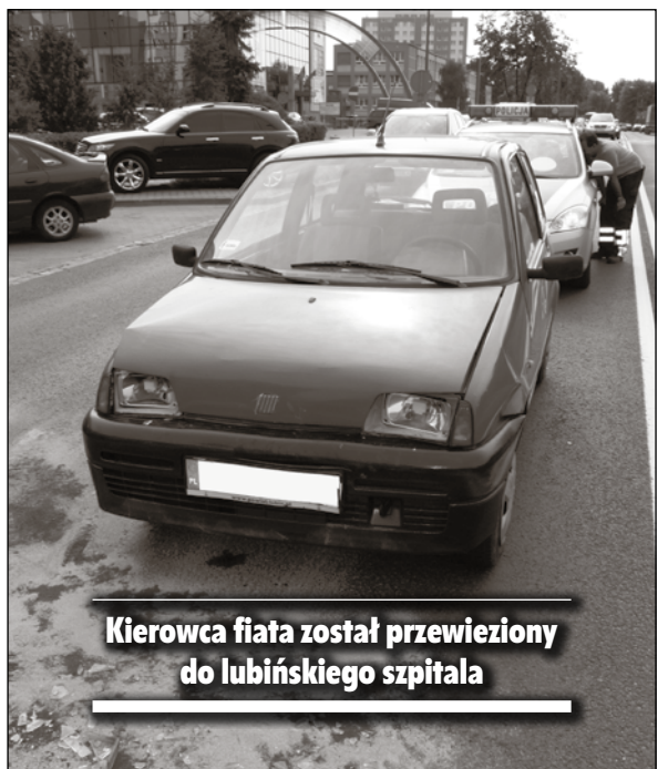
Kierowca fiata został przewieziony do lubińskiego szpitala