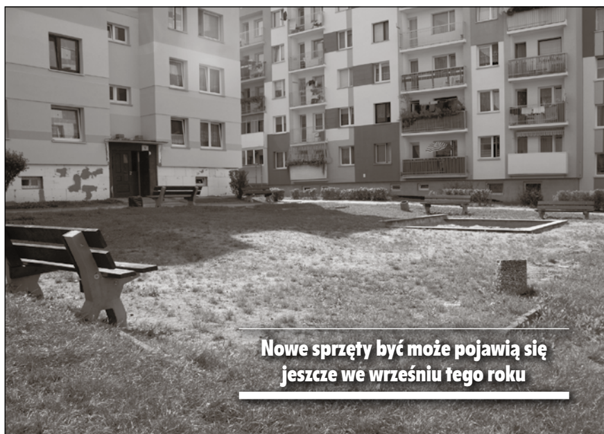
■ Nowe sprzęty być może pojawią się jeszcze we wrześniu tego roku