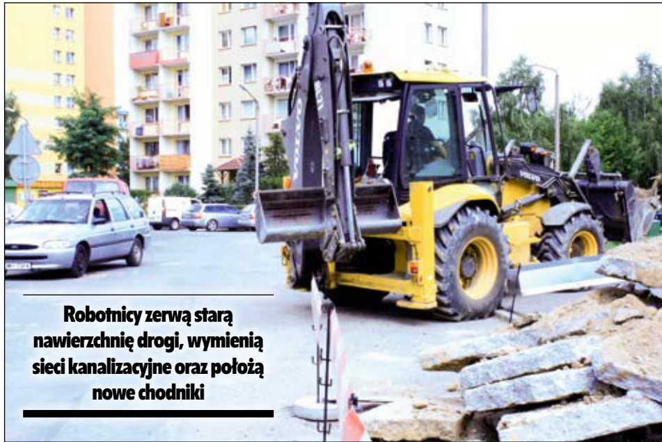
Robotnicy zerwą starą nawierzchnię drogi, wymienią sieci kanalizacyjne oraz położą nowe chodniki

W związku z utrudnieniami przewidziano szereg dojazdów i tymczasowych parkingów. Miejsca postojowe znajdować się będą: wzdłuż ulicy Szpakowej, przy ulicy Leśnej w wjazdem od ulicy Sowiej oraz przy ulicy Żurawiej z możliwością dojazdu do ulicy Kruczej (plac po