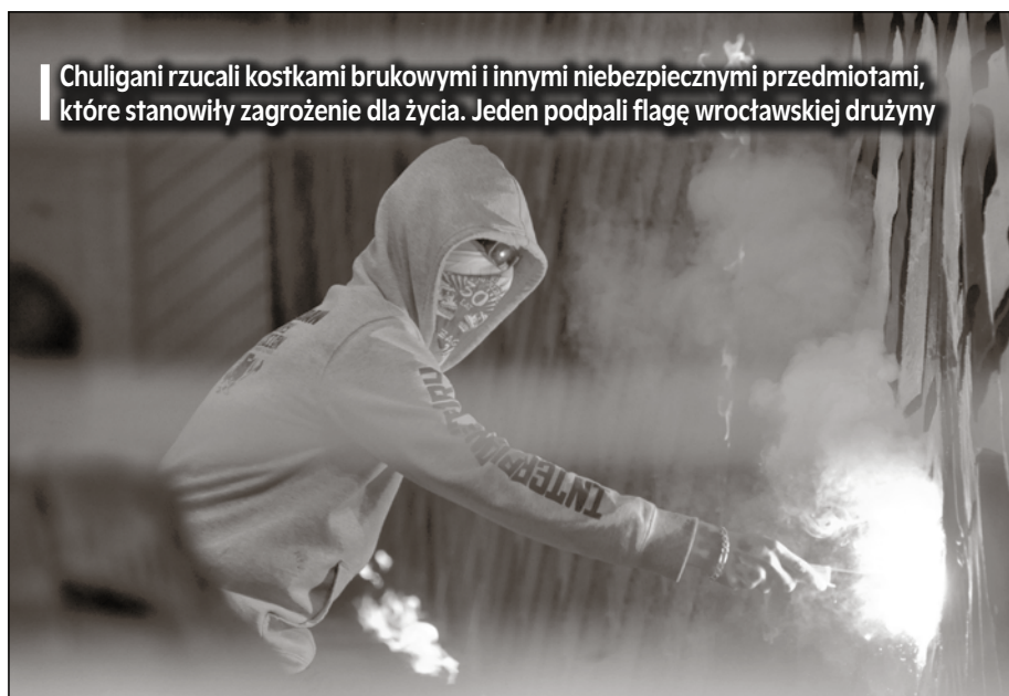
Chuligani rzucali kostkami brukowymi i innymi niebezpiecznymi przedmiotami, które stanowiły zagrożenie dla życia. Jeden podpalił flagę wrocławskiej drużyny

Ośmiu pseudokibiców, którzy uczestniczyli w zadymie podczas grudniowego spotkania Zagłębia Lubin z Legią Warszawa, odpowie za uczestnictwo w burdzie. Oskarżonych, w wieku od 19 do 31 lat, czeka proces przed lubińskim sądem rejonowym.