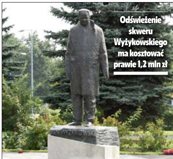
Odświeżenie skweru Wyżykowskiego ma kosztować prawie 1,2 mln zł

Skwer ma się zmienić na zewnątrz i wewnątrz. Wokół niego stanie pięć bram