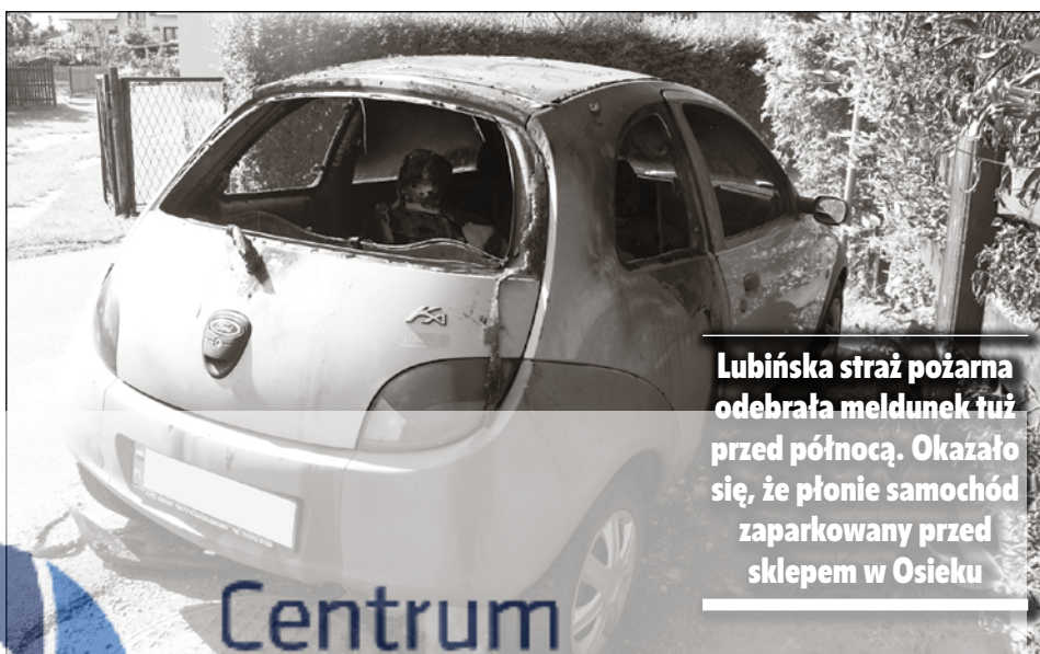
Lubińska straż pożarna odebrała meldunek tuż przed północą. Okazało się, że płonie samochód zaparkowany przed sklepem w Osieku