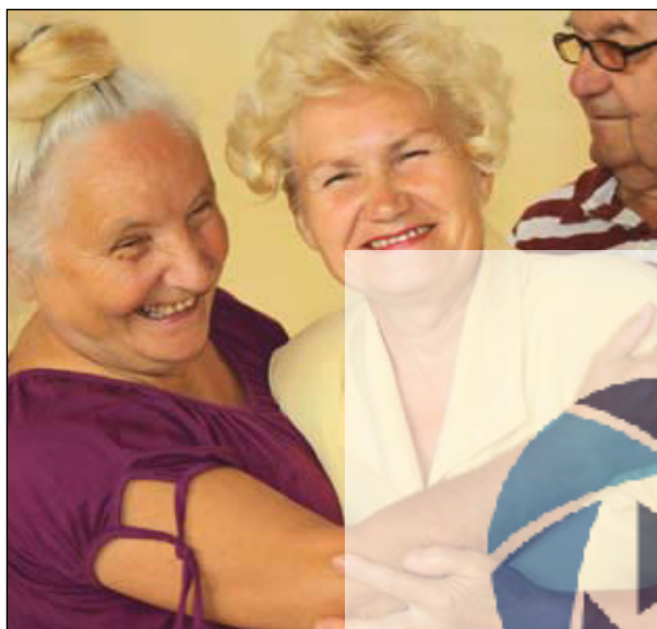
Na takie zajęcia może przyjść każdy