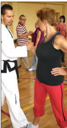
Naukę zaczęli od najprostszych metod, jak nie dać się obezwładnić

Naukę zaczęli od najprostszych metod, jak nie dać się obezwładnić. – Nie trzeba mieć dużo siły, by móc się obronić – tłumaczył instruktor. Każdy mógł wypróbować sposób na partnerze z grupy bądź samym instruktorem. Seniorów czeka jeszcze cykl zajęć do 27 sierpnia. Z każdym dniem będą uczyć się coraz bardziej zaawansowanych metod.