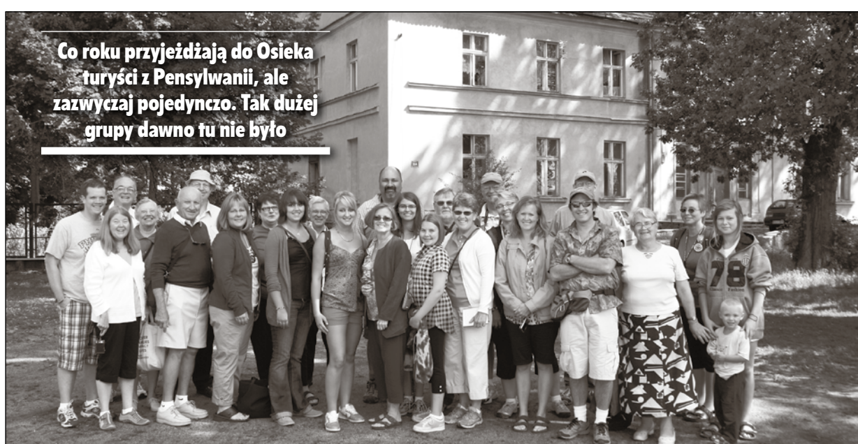
Co roku przyjeżdżają do Osieka turyści z Pensylwanii, ale zazwyczaj pojedynczo. Tak dużej grupy dawno tu nie było