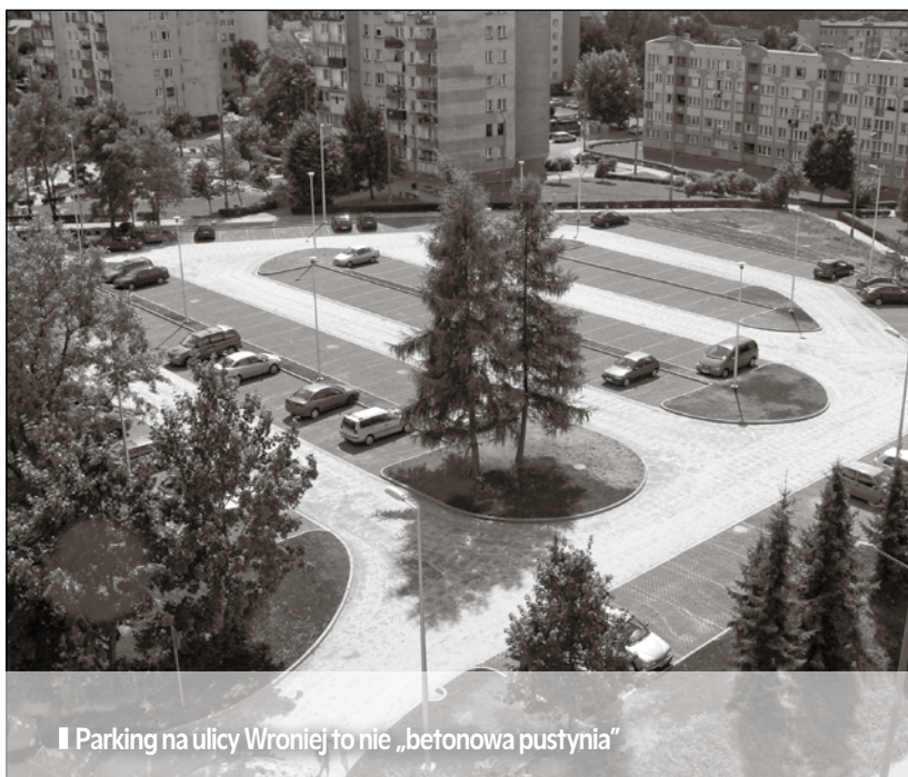
■ Parking na ulicy Wroniej to nie „betonowa pustynia”