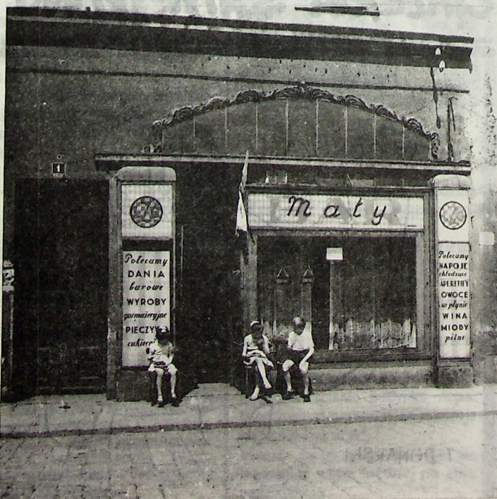
1955 - Bar Maty przy ul. Panińskiej

Tradycyjnie, jako co roku Klub Wodny LOK organizuje festyn muzyki żeglarskiej i jej podobnej. Jak zwykle impreza odbędzie się na początku czerwca. Dzisiaj wszyscy marynarze z gitarami mogą zgłaszać swój udział w Shanties'91 (kontakt: Kunice KW LOK).