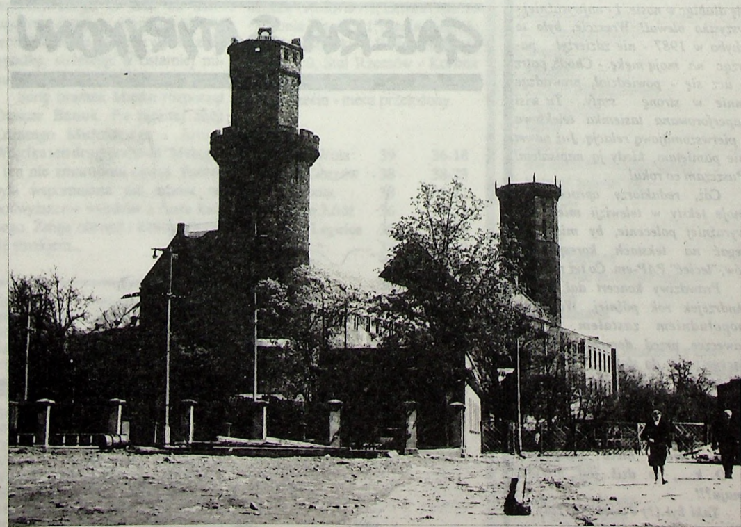
Legnica, 1965 rok, Zamek