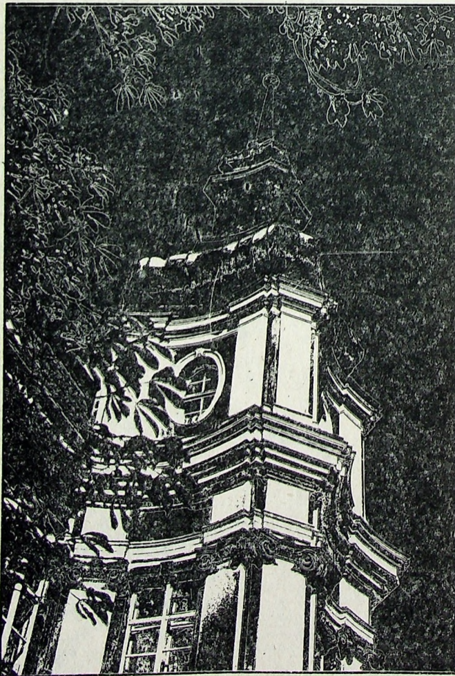
Legnica, 1959 Wieża starego Ratusza