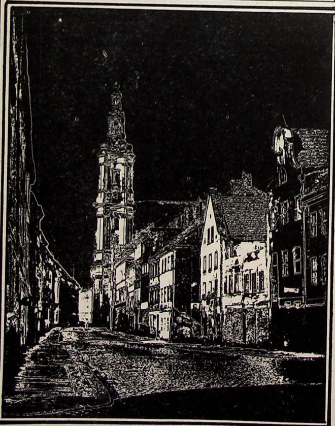
Legnica, 1960, ul. Partyzantów

Dawna Legnica w obiektywie Mieczysława Pawętka