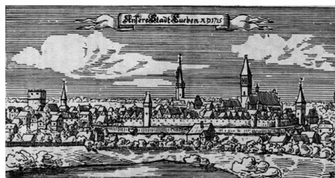
„Spacer po dawnym Lubinie” hol na I piętrze 2.11.2025 - 8.01.2026

Na wszystkie wystawy wstęp jest wolny. Serdecznie zapraszamy. UF