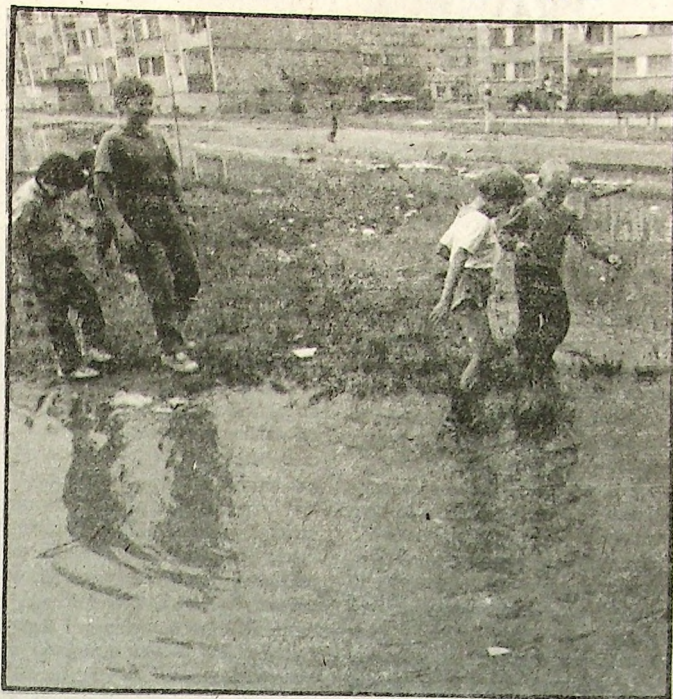
fol. St. Celoch

W czasie deszczu dzieci się nudzą... Ale po deszczu jest ciekawiej. Zalane wodą place zamieniają się w "cudowne" miejsca sielanki małych. Można pograć sobie w piłkę, puszczać steropianowe łódki lub najwzajemniej w świecie pochłapać się brudną mazią. Nic to, że później matki załamują ręce nad wyglądem swych pociech, a