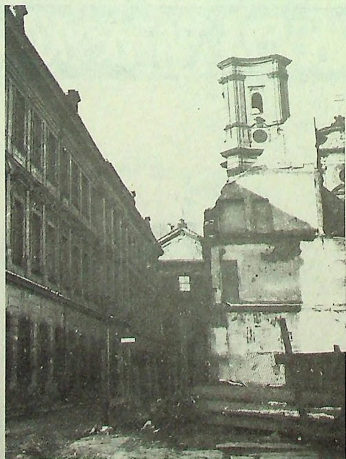
Legnica 1970, ul. św. Jana