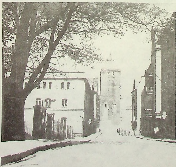
Legnica 1960 r. ul. Gwarna