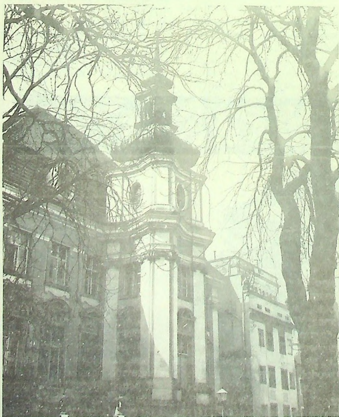
Legnica 1968 r. - Rynek