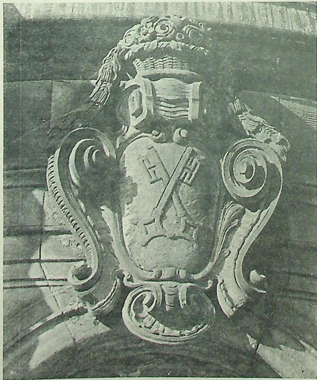
Gdzie znajduje się ten herb?

Autorzy wszystkich trafnych odpowiedzi wezmą udział w losowaniu nagród. Sponsorem niniejszego konkursu jest Zarząd Wojewódzki PTTK w Legnicy, który wraz z Redakcją Gazety Legnickiej ufundował nagrody.