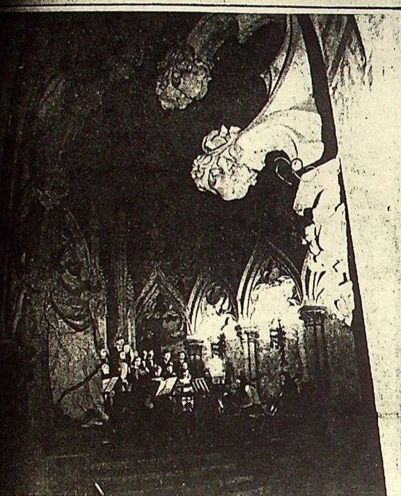
Wzięli się już XXIV Legnickie Dni Muzyki Organowej. Pierwszy z koncertu finałowego na str. 5.