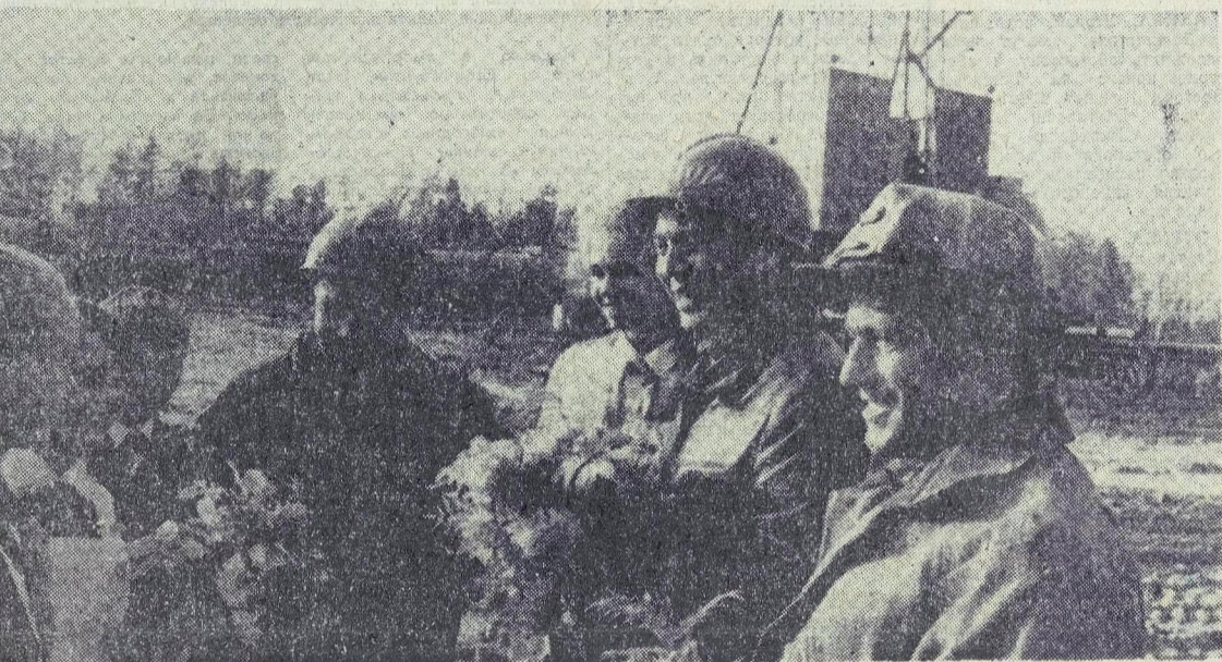
ТЮМЕНСКАЯ ОБЛАСТЬ. Крупнейшее в Западной Сибири Нижнеартское управление буровых работ. № 1 досрочно выполнил девятый пятилетний план. Разрушая уникальное Самогорское нефтяное месторождение, его коллектив в сложных условиях Севера построил более миллиона ста шестидесяти тысяч метров скважин, эксплуатация которых увеличила добычу сибирской нефти на десятки миллионов тонн.

В СЕРЕДИНЕ 50-х годов вместе с освоением целинных и залежных земель в Казахстане стал бурно развиваться Павлодарский энергопромышленный комплекс. На базе дешевого экибастуского угля была построена Ермаковская ГРЭС. Она дала электроэнергию в короткие сроки созданному Павлодарскому алюминиевому заводу, работающему на Бокситов Гурьевского месторождения, нескольких железобетонных заводах.