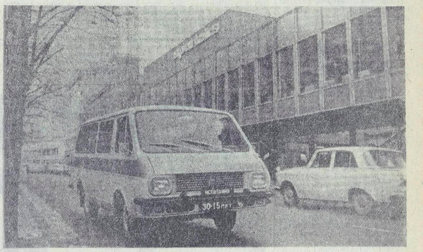
ЛАТВИЙСКАЯ ССР. На окраине Елгавы выросли корпуса предприятия латвийского автомобилестроения — завода РАФ. На снимке: эта легкая и стремительная машина — базовая модель РАФ-2203 «Латвия» — основная продукция нового завода. Пока эти машины ходят с табличкой «Испытание».

Участники совещания обменялись опытом идеологической работы. Командиры, политорганы, партийные, комсомольские организации, подчеркивая свои успехи, признали свои недостатки. Это будет стимулом к дальнейшему совершенствованию идейно-воспитательной работы. Командиры, политорганы, партийные, комсомольские организации, подчеркивая свои успехи, признали свои недостатки. Это будет стимулом к дальнейшему совершенствованию идейно-воспитательной работы.