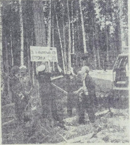
ИРКУТСКАЯ ОБЛАСТЬ. В приагартской тайге, неподалеку от Усть-Илимской ГЭС, начато строительство крупного лесопромышленного комплекса. С помощью стран — участниц СЭВ здесь будут построены целлюлозный и газификационный заводы, лесоперерабатывающая база, завод древесностружечных плит и другие производственные объекты.

На снимке: перестройка комплекса (слева направо) буровых скважин в нефтяном месторождении.