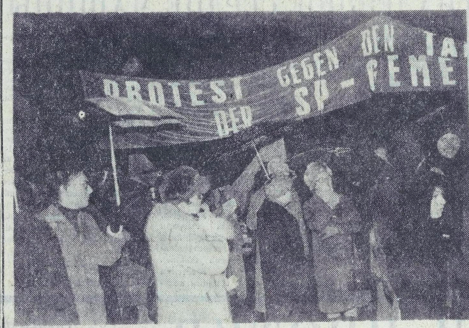
ВЕНА. Трудящиеся австрийской столицы решительно выступают против роста дороговизны. По призыву коммунистических и студенческих организаций тысячи жителей города вышли на улицы, чтобы выразить свой протест против решения магистрата о значительном повышении тарифов на электроэнергию, газ и проезд в трамваях. Демонстрация завершилась митингом перед городской ратушей. На снимке: участники манифестации.