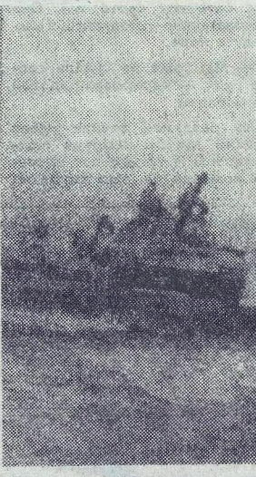
На снимках: сверху — офицер Н. ГУШИН...