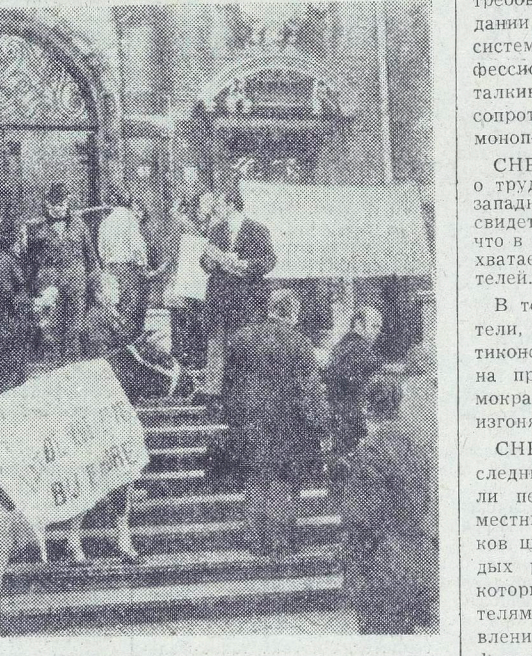
АМСТЕРДАМ. Представители крестьянских организаций Голландии провели демонстрацию протеста против сельскохозяйственной политики «Общего рынка», ведущей к разорению и ликвидации тысяч мелких и средних фермерских предприятий.

ПЕКИН, 12 февраля. (ТАСС). В Пекин прибыла глава советской правительственной делегации на советско-китайских переговорах по урегулированию пограничных вопросов заместитель министра иностранных дел СССР Л. Ф.