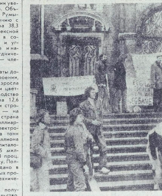
АМСТЕРДАМ. Представители крестьянских организаций Голландии провели демонстрацию протеста против сельскохозяйственной политики «Общего рынка», ведущей к разорению и ликвидации тысяч мелких и средних фермерских предприятий.

БЕЛГРАД, 12 февраля. (ТАСС). Скульптура Нарциссе Радичевича установлена в центре города в память Карлу Марксу. Он будет сооружен рядом с типографией, в которой в 1871 году впервые на территории нынешней Югославии был издан «Манифест коммунистической партии».