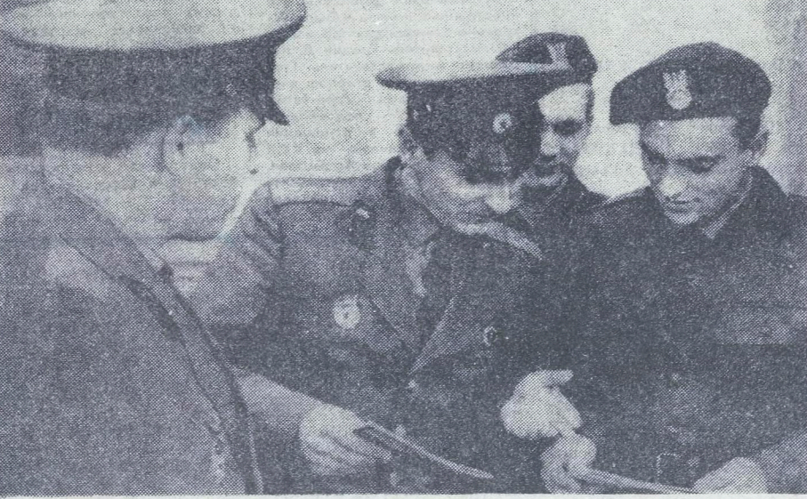
Встреча братьев по оружию — советских и польских воинов.