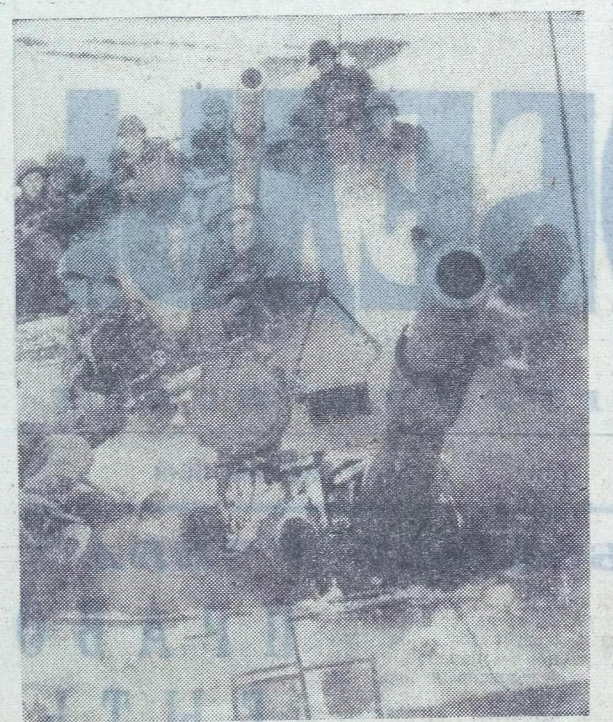
Десантом на танках.