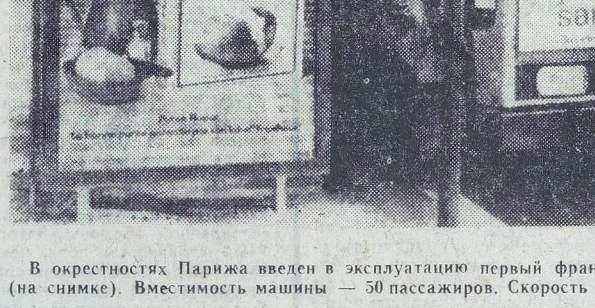
В окрестностях Парижа введен в эксплуатацию первый французский электрический автобус...