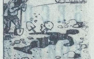
Окоп в полный профиль.