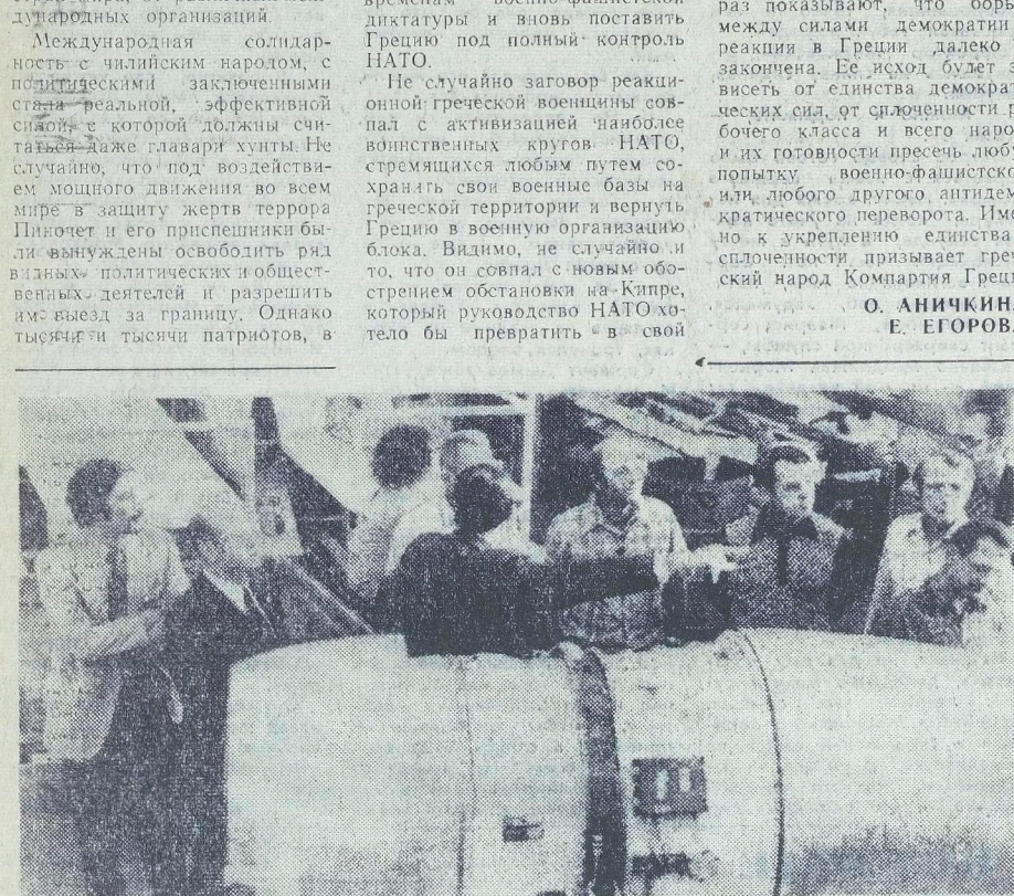
США — 1975 год войдет в историю как «год ЭПАС» — первого совместного экспериментально-го полета космических кораблей «Аполлон» — «Союз». Программа ЭПАС предусматривает совместную разработку двумя странами стыковочного устройства и испытания его в космосе, а также приспособление двух кораблей разных систем к общей работе в качестве единого целого. Общие задачи будут выполнять и экипажи — советские космонавты и американские астронавты. На снимке: советские космонавты В. А. ШАТАЛОВ, В. Н. КУБАСОВ и А. А. ЛЕОНОВ во время пребывания в Центре управления космическими полетами в Хьюстоне.