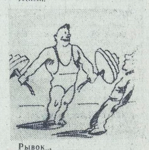
Рывок... Рис. Г. Сажина.