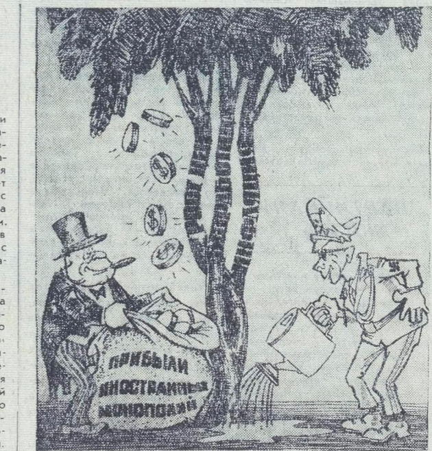
Быстрорастущая «культура» Пиночета. Рис. М. Салина.