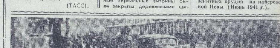
Первые жертвы варварского обстрела Ленинграда немецкой артиллерией.

Удивительно порой переключаются человека чужие судьбы. Пока П. Г. Михайлин и сотни его товари-