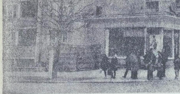
На снимках: сверху — жолнеры одной из частей приносят морю; слева — Кольберг в эти дни.

Фашисты знали, что они обречены: ведь западнее города