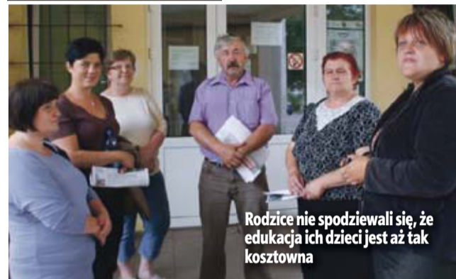
Rodzice nie spodziewali się, że edukacja ich dzieci jest aż tak kosztowna

w którym uczestniczyli rodzice uczniów. Argumentowali, by nie likwidować szkoły. Nie spodziewali się jednak, że edukacja ich dzieci jest aż tak kosztowna.