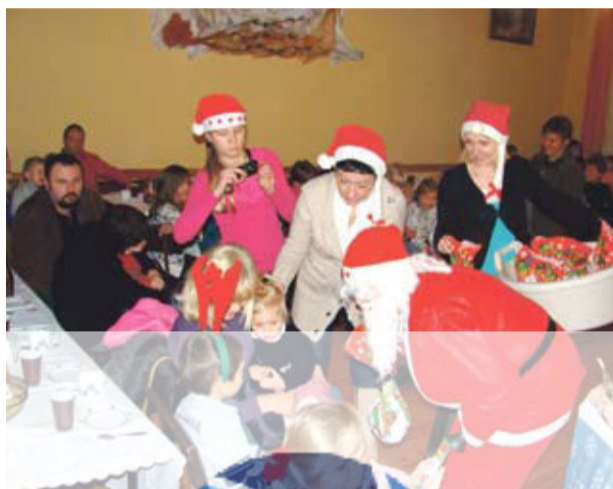
Dzieci między innymi spotkały się z Mikołajem

Podzielili się opłatkiem i skosztowali ciast