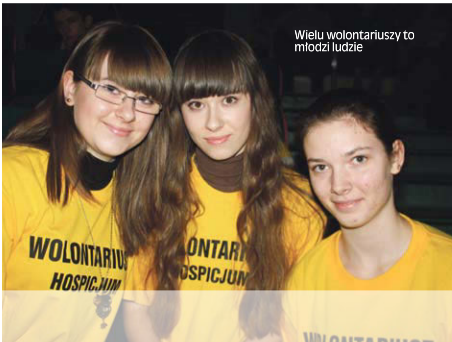
Wielu wolontariuszy to młodzi ludzie