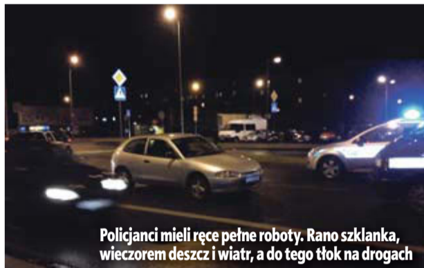
Policjanci mieli ręce pełne roboty. Rano szklanka, wieczorem deszcz i wiatr, a do tego tłok na drogach

Nieco więcej wiadomo na temat podwójnej kolizji, do jakiej doszło na drodze krajowej nr 3 w kierunku Legnicy. Jadącą peugeotem 39-letnia mieszkanka powiatu lubińskie-