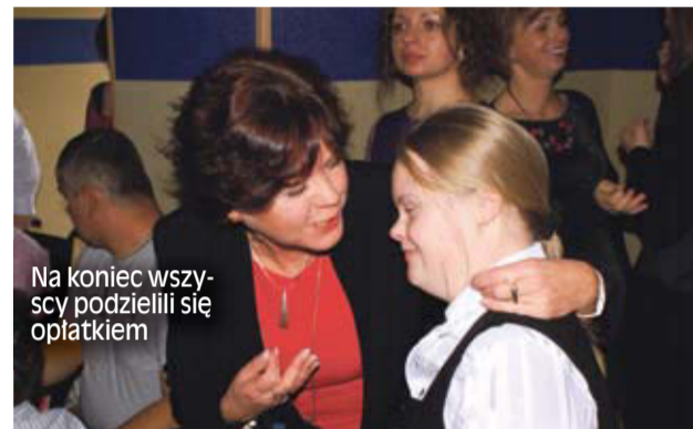
Na koniec wszyscy podzielili się opłatkiem

Na koniec wszyscy podzielili się opłatkiem, składa-