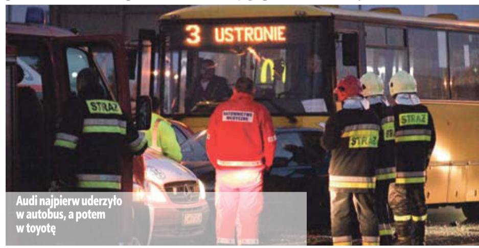
Audi najpierw uderzyło w autobus, a potem w toyotę

– Zdarzenie zostało zakwalifikowane jako kolizja – informuje rzecznik lubińskiej policji. – Sprawca został ukarany mandatem w wysokości 500 zł i sze-