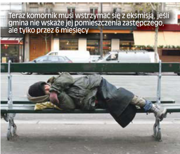
Teraz komornik musi wstrzymać się z eksmisją, jeśli gmina nie wskaże jej pomieszczenia zastępczego, ale tylko przez 6 miesięcy

Uchylenie się przez gminę od tego obowiązku jest bezprawne. Teraz komornik musi wstrzymać się z eksmisją, jeśli gmina nie wskaże jej pomieszczenia zastępczego, ale tylko przez 6 miesięcy. Po upływie tego czasu komornik musi