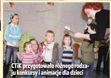
CTiK przygotowało różnego rodzaju konkursy i animacje dla dzieci

Ponadto CTiK przygotowało różnego rodzaju konkursy i animacje dla dzieci, gdzie widownia nagradzana była słodkimi upominkami. Na zakończenie wystąpił Te-