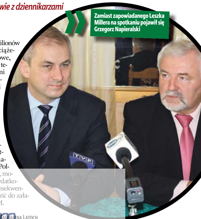
Zamiast zapowiadanego Leszka Millera na spotkaniu pojawił się Grzegorz Napieralski

Politycy obawiają się, że pieniądze z podatku, które mają wyleczyć Polskę z kryzysu, mogą być źle wydatkowane, a w konsekwencji doprowadzić do załamania KGHM.