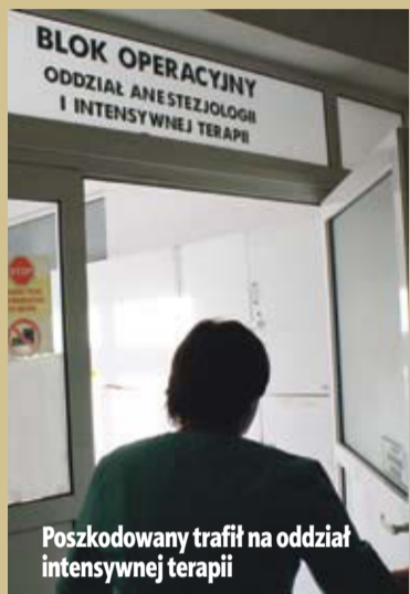
Poszkodowany trafił na oddział intensywnej terapii

Mężczyzna nie miał przy sobie dokumentów, dlatego lekarze nie mogli ustalić, kim jest ich pacjent. Trzydzieści minut po północy, przy przejściu dla pieszych, na ulicy Odrodzenia, 27-letni kierowca fordą potrącił przechodnia. Poszkodowany trafił na oddział intensywnej terapii.