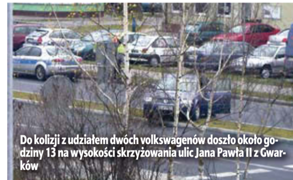
Do kolizji z udziałem dwóch volkswagenów doszło około godziny 13 na wysokości skrzyżowania ulic Jana Pawła II z Gwaraków

W tym przypadku przyczyna zderzenia była jed-