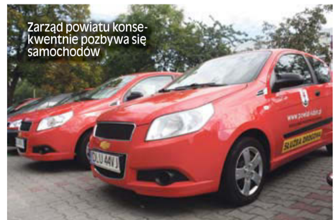
Zarząd powiatu konsekwentnie pozbywa się samochodów

Udało się sprzedać kolejne dwa samochody należące do starostwa. Nowych nabywców znalazły dwie osobówki: kia rio i chevrolet aveo.