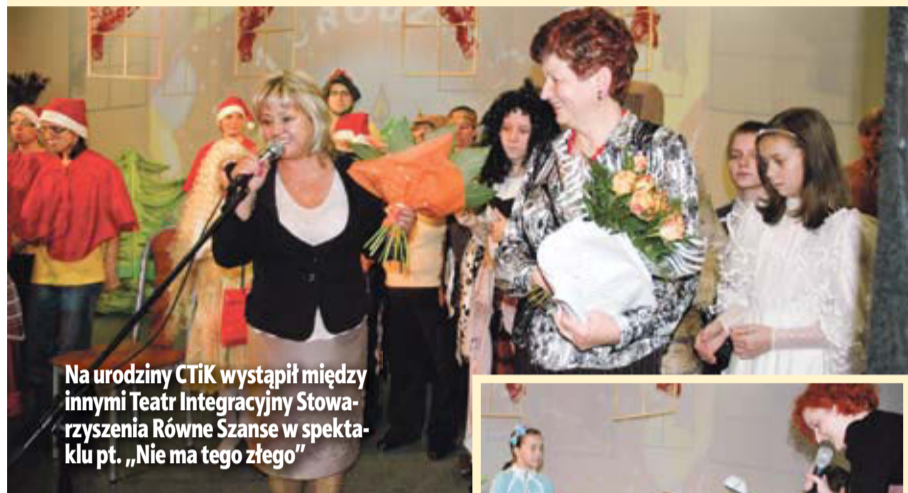
Na urodziny CTiK wystąpił między innymi Teatr Integracyjny Stowarzyszenia Równe Szanse w spektaklu pt. „Nie ma tego złego”

» Miejsowe Centrum Turystyki i Kultury w Ścinawie obchodziło swoje pierwsze urodziny. Z tej okazji przygotowano specjalne niespodzianki dla dzieci.