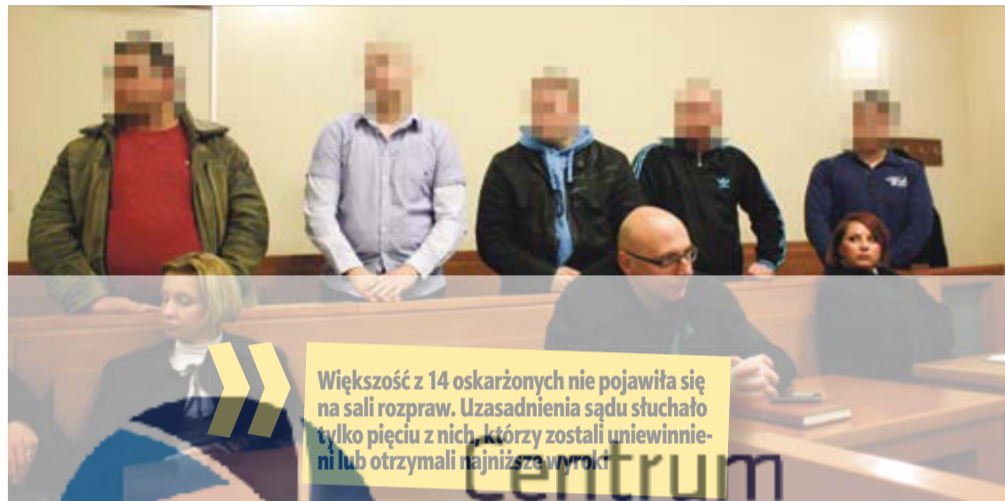
Większość z 14 oskarżonych nie pojawiła się na sali rozpraw. Uzasadnienia sądu słuchało tylko pięciu z nich, którzy zostali uniewinnieni lub otrzymali najniższe wyroki