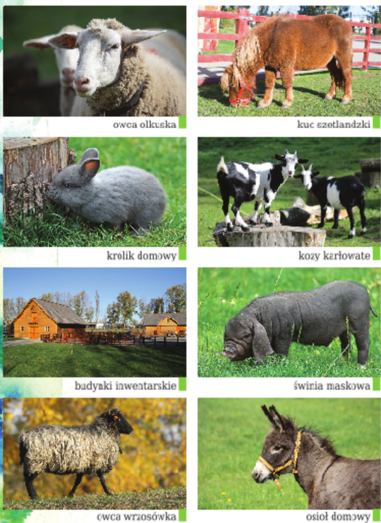
owca wrośowska, owca olkaska, kucz szetlandzki, królik domowy, kury karłowate, kury zwyczajne, bafyaki lwiatarskie, wiewiórka maskowa, owca wrośowska, osioł domowy

W lubińskim zoo zobaczyć można także gatunki sdomowionych zwierząt jak kury, kuce, owce, kury, osły czy świnię. Miejsce to jest szczególnie atrakcyjne dla dzieci, które w bezpośredni sposób mogą poznać zwierzęta towarzyszące człowiekowi od wieków, jednak coraz rzadziej widziane, zwłaszcza w miastach. Na szczególną uwagę zasługują tu przedstawiciele polskich ras rodzimych: owca wrośowska, owca olkaska, koza karpaska, koza sandomierska, zielenożółta kropkowania czy zwana polską brodatą miniaturowa. W zagrodzie zwierząt gospodarskich zobaczyć można m.in. osły, indyki, perlice, drożdki, kury Serana.