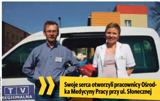
Swoje serca otworzyli pracownicy Ośrodka Medycyny Pracy przy ul. Słonecznej

Okazało się, że los tych ludzi nie jest obojętny miesz-