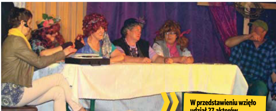
W przedstawieniu wzięło udział 27 aktorów

» „Znaki czasu” to tytuł premierowego przedstawienia wielkopostnego, wystawionego przez Teatr na Końcu Świata, które odbyło się w sobotę w Nieszczytach.