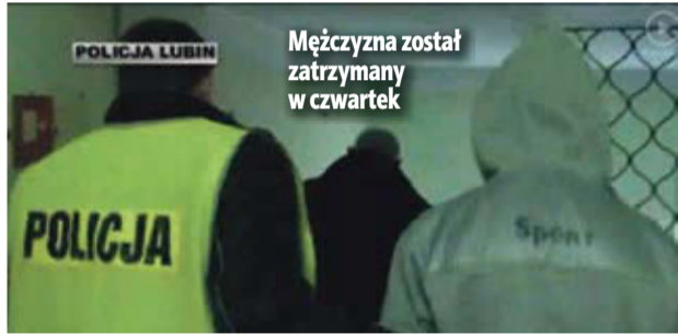
Mężczyzna został zatrzymany w czwartek

Zatrzymany to młody mężczyzna z powiatu lubińskiego. Póki co podejrzany jest o dokonanie dwóch przestępstw. Dla dobra rodziny sprawcy, prokuratura nie udziela żadnych informacji na temat podejrzanego. Nie