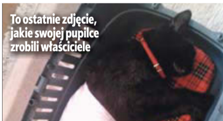
To ostatnie zdjęcie, jakie swojej pupilce zrobili właściciele