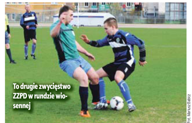
To drugie zwycięstwo ZZPD w rundzie wiosennej