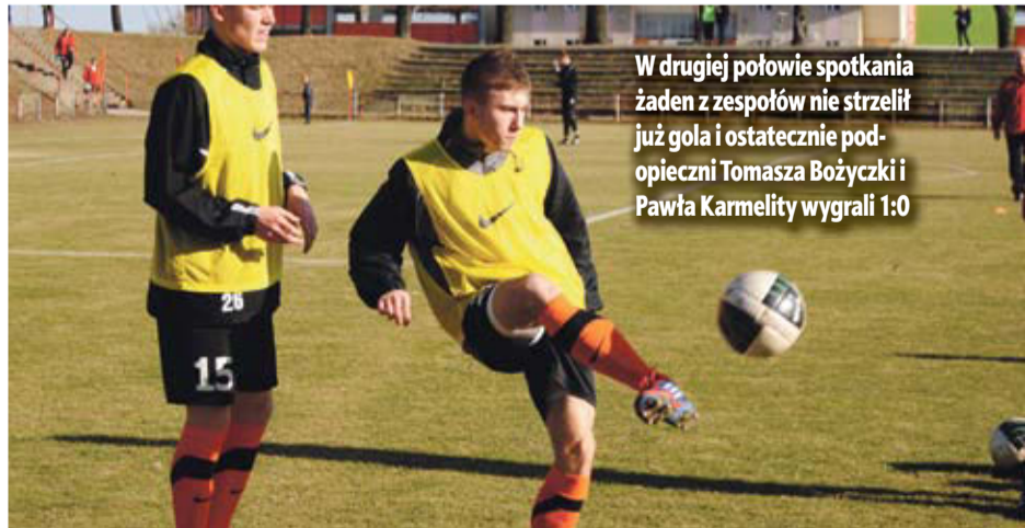
W drugiej połowie spotkania żaden z zespołów nie strzelił już gola i ostatecznie podopieczni Tomasza Bożyczki i Pawła Karmelity wygrali 1:0