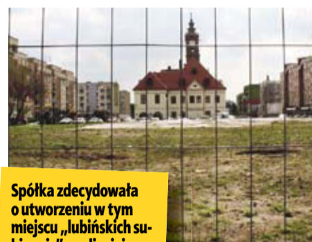
Spółka zdecydowała o utworzeniu w tym miejscu „lubińskich sukiennic”, czyli miejsca spotkań i odpoczynku

– To będzie mniejszy budynek, gdzie będą przeważały kawiarnie i restauracje. A wokół ławki, fontanna i zieleń – opowiada wiceprezes spółki.