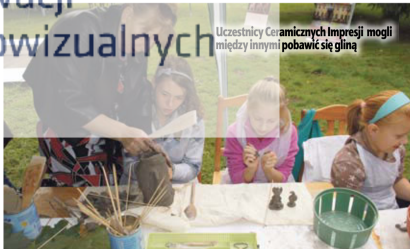
Uczestnicy Ceramicznych Impresji mogli między innymi pobawić się gliną

Stowarzyszenie Pro-Humanitatis. Projekt został zrealizowany dzięki wsparciu Fundacji Polska Miedź oraz przy