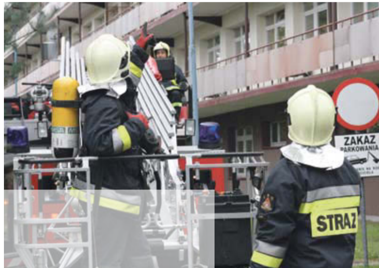
W działaniach brały udział trzy zastępy straży pożarnej