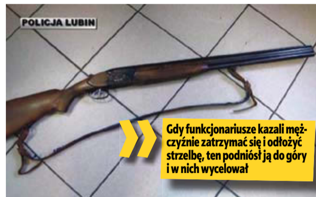
Gdy funkcjonariusze kazali mężczyźnie zatrzymać się i odłożyć strzelbę, ten podniósł ją do góry i w nich wycelował

– Funkcjonariusze szybko obezwładnili i zatrzymali podejrzanego. Był nim 64-letni