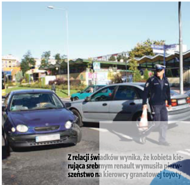
Z relacji świadków wynika, że kobieta kierująca srebrnym renault wymusiła pierwszeństwo na kierowcy granatowej toyoty