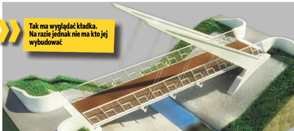
Tak ma wyglądać kładka. Na razie jednak nie ma kto jej wybudować