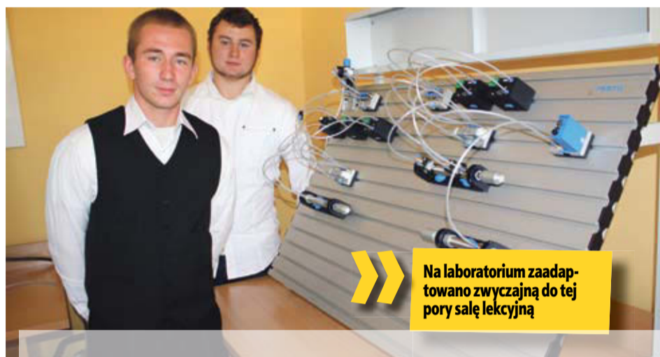
» Na laboratorium zaadaptowano zwyczajną do tej pory salę lekcyjną

Na laboratorium zaadaptowano zwyczajną do tej pory salę lekcyjną. Pomieszczenie wyremontowano, wyposażono w nowe meble, a także w zestaw