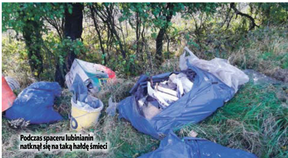
Podczas spaceru lubinianin natknął się na taką hałdę śmieci

Mężczyzna jest oburzony zachowaniem mieszkańców. – Jak to jest możliwe, że w XXI wieku ludzie zachowują się w ten sposób? Czy na wysypisku w Lubinie już nie ma miejsca na śmieci, że trzeba je wyrzucać wprost na łono natury? Rozumiem, że teren ten już nie jest pod jurysdykcją miasta, ale ktoś z tym powinien zrobić porządek?