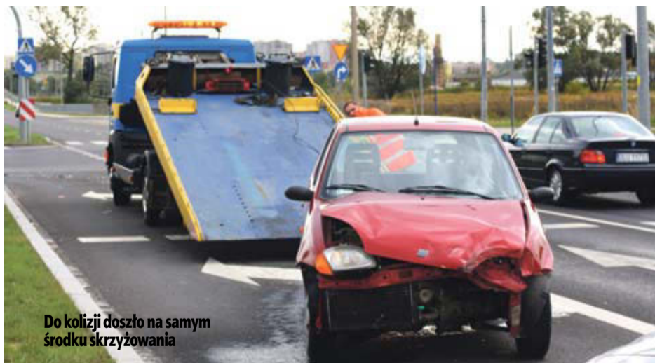
Do kolizji doszło na samym środku skrzyżowania

» Mandat i sześć punktów karnych otrzymała 82-letnia lubinianka, która 27 września rano wymusiła pierwszeństwo na obwodnicy, doprowadzając tym samym do kolizji. Na drodze staruszki, prowadzącej fiata seinceto, niespodziewanie pojawił się ford mondeo. Kierowała nim o 23 lata młodsza mieszkanka Lubina.