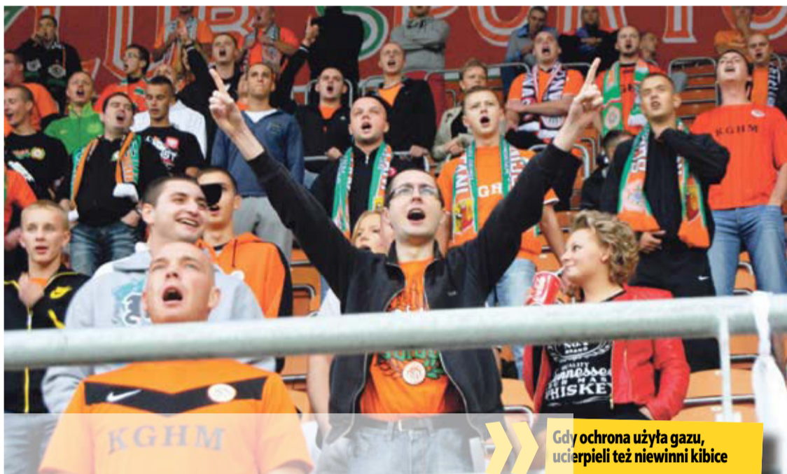
Gdy ochrona użyła gazu, ucierpieli też niewinni kibice