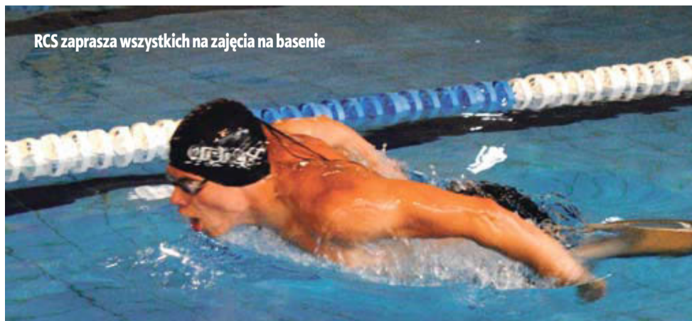
RCS zaprasza wszystkich na zajęcia na basenie

» Regionalne Centrum Sportowe wznawia cieszące się dużą popularnością zajęcia aquaerobiku, które odbywają na basenie Centrum 7 oraz na pływalni Ustronie IV.