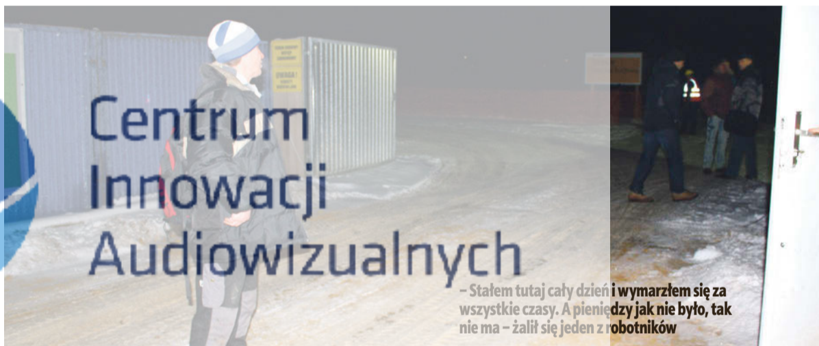
– Stałem tutaj cały dzień i wymarłem się za wszystkie czasy. A pieniędzy jak nie było, tak nie ma – żalił się jeden z robotników