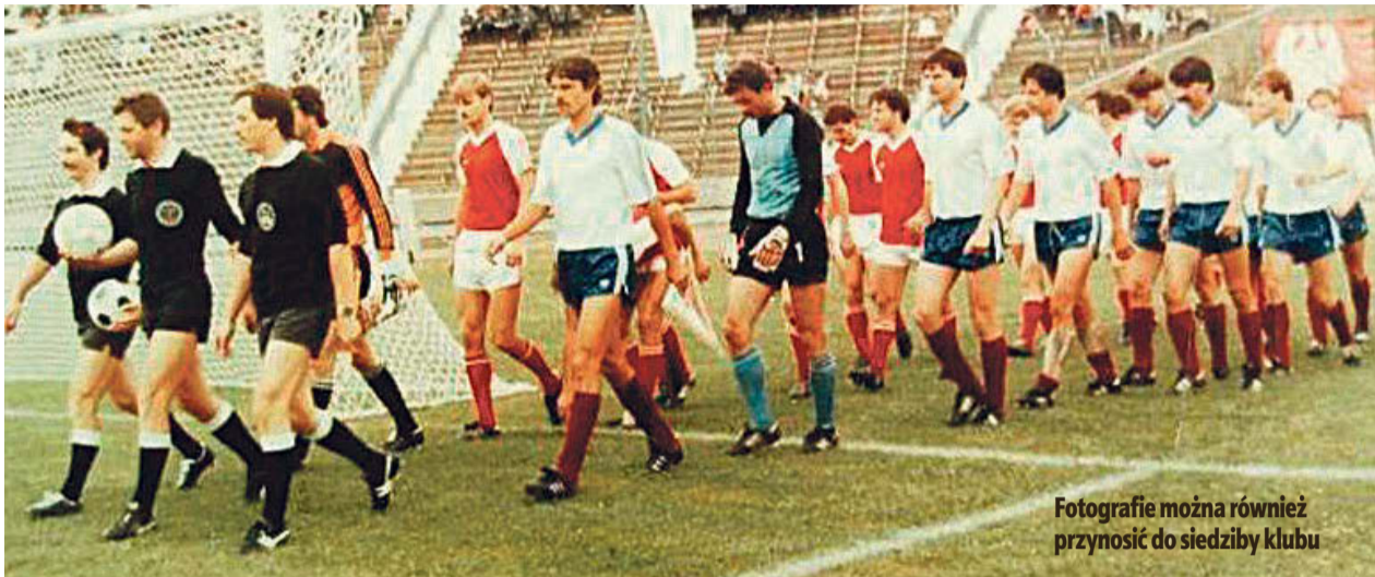
Fotografie można również przynosić do siedziby klubu