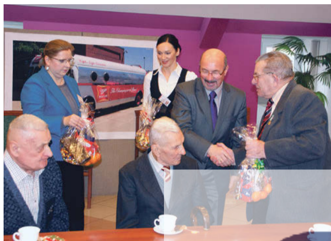
Łza wzruszenia zakręciła się w niejednym oku. Kombatanci bardzo ucieszyli się ze spotkania ze starostą i uczniami ZSS