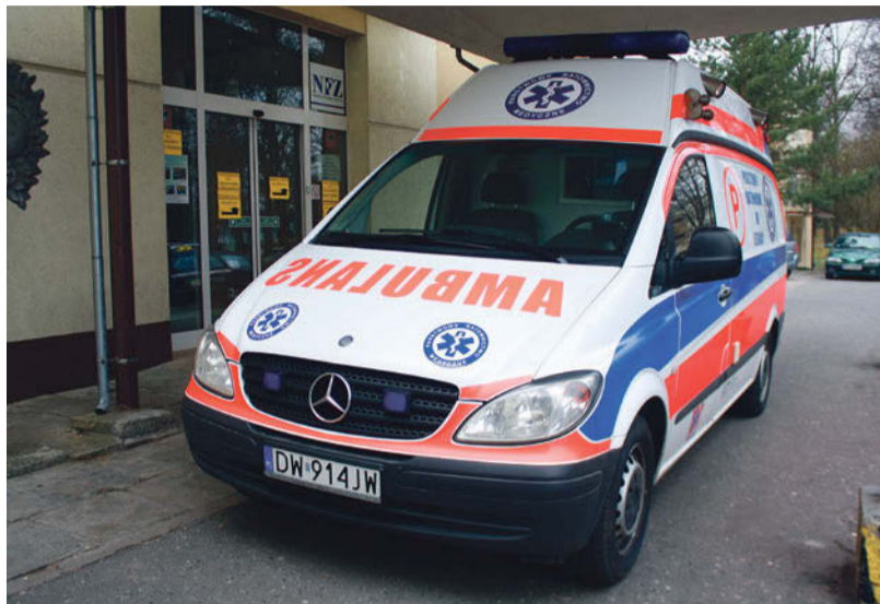
SOR w lubińskim szpitalu powstanie, ale trzeba go zaplanować zupełnie od nowa, od podstaw

– Zastanawialiśmy się nad zmianą projektu, ale instytucja wdrażają-