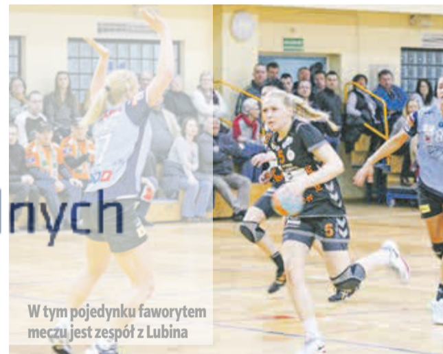
W tym pojedynku faworytem meczu jest zespół z Lubina