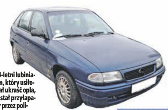
34-letni lubinianin, który usiłował ukraść opla, został przyłapany przez policjantów

» Byłsk świateł awaryjnych auta, zaparkowanego na lubińskim Przylesiu, zainteresował policjantów patrolujących osiedlowe parkingi. Kiedy około czwartej nad ranem 14 września podeszli do samochodu, zauważyli mężczyznę leżącego na przednich fotelach.