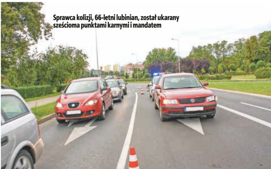
Sprawca kolizji, 66-letni lubinian, został ukarany sześcioma punktami karnymi i mandatem

Sprawca kolizji, 66-letni lubinian, został ukarany sześcioma punktami karnymi i mandatem. MARCELINA FALKIEWICZ