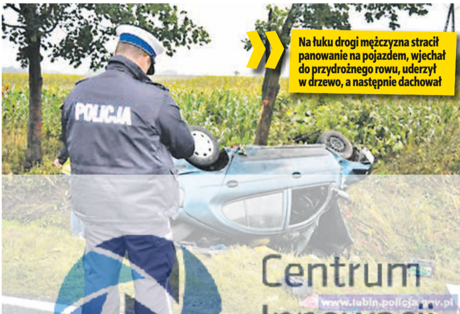
Na łuku drogi mężczyzna stracił panowanie na pojeździe, wjechał do przydrożnego rowu, uderzył w drzewo, a następnie dachował

wiatu polkowickiego. Jechał od Krzeczyna Wielkiego do Lubina. Na łuku drogi stracił panowanie nad pojazdem, wjechał do przydrożnego rowu, uderzył w drzewo, a następnie dachował. Wraz z nim podróżowała 28-letnia kobieta, dwoje dzieci w wieku 5 i 3 lata oraz 36-letni mężczyzna. JOANNA MICHALAK