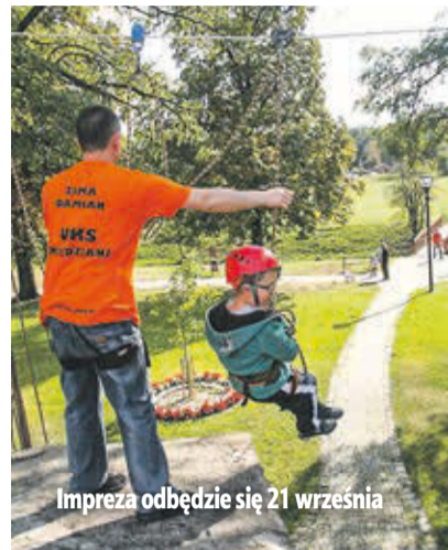
Impreza odbędzie się 21 września

– Już po raz drugi organizujemy rozpoczęcie sezonu.