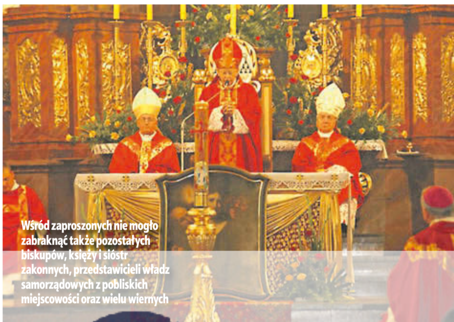
Wśród zaproszonych nie mogło zabraknąć także pozostałych biskupów, księży i sióstr zakonnych, przedstawicieli władz samorządowych z pobliskich miejscowości oraz wielu wiernych

Wśród zaproszonych nie mogło zabraknąć także pozostałych biskupów, księży i sióstr zakonnych, przedstawicieli władz samorządowych z pobliskich miejscowości oraz wielu wiernych.