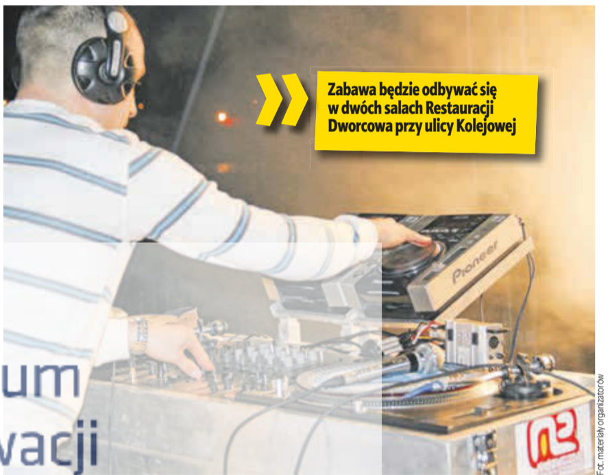
Zabawa będzie odbywać się w dwóch salach Restauracji Dworcowa przy ulicy Kolejowej

– Chcemy, żeby to były imprezy na wyższym poziomie. Żeby była to konkurencja dla dyskotek w Legnicy czy Głogowie. Żeby ludzie nie wyjeżdżali poza Lubin, jeśli chcą się pobawić – stwierdza jeden z organizatorów zabawy. – Jeśli będzie zainteresowanie, to moglibyśmy organizować takie dyskoteki co sobotę. Każda impreza byłaby w innej tematyce.