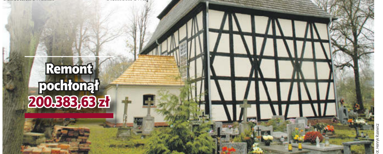
Remont pochłonął 200.383,63 zł