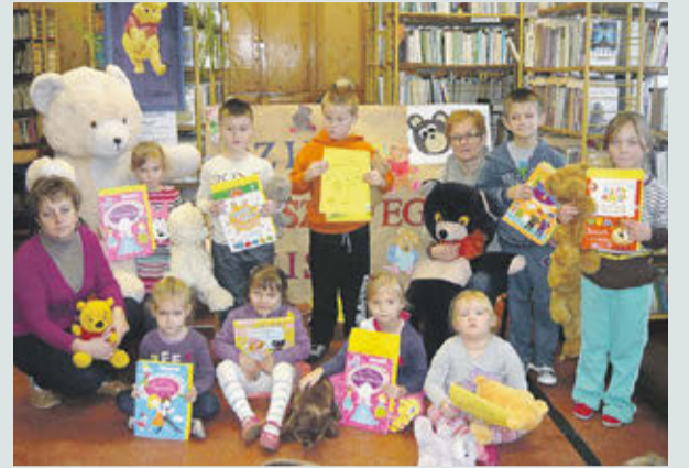
Wszyscy biorący udział w konkursie otrzymali dyplomy oraz nagrody, a ich prace zaprezentowano w holu szkolnym