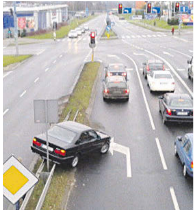
Funkcjonariusze ustalili, że 19-latek jechał zbyt szybko i nie zdołał zapanować nad samochodem

Funkcjonariusze ustalili, że 19-latek jechał zbyt szybko i nie zdołał zapanować nad sa-