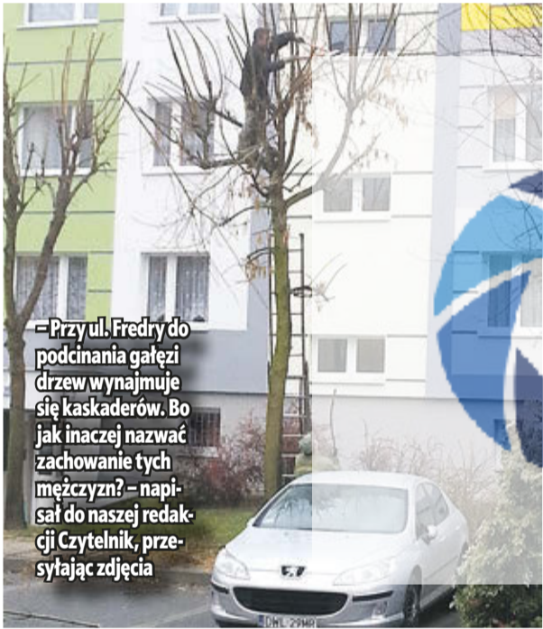
– Przy ul. Fredry do podcinania gałęzi drzew wynajmuje się kaskaderów. Bo jak inaczej nazwać zachowanie tych mężczyzn? – napisał do naszej redakcji Czytelnik, przesyłając zdjęcia