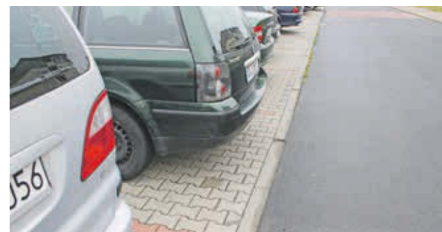
Z prowadzonych przez biuro komunikacji Starostwa Powiatowego w Lubinie statystyk wynika, że w stosunku do drugiej połowy 2013 roku, liczba rejestrowanych aut wzrosła zaledwie o 10