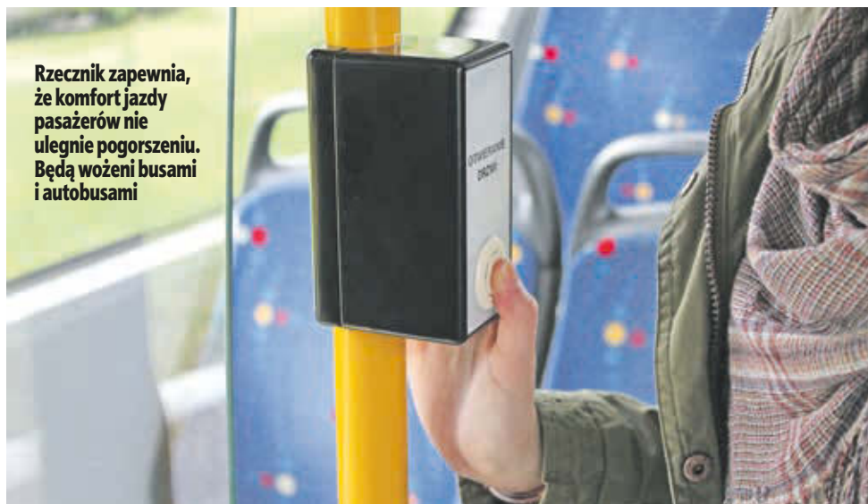
Rzecznik zapewnia, że komfort jazdy pasażerów nie ulegnie pogorszeniu. Będą wożeni busami i autobusami

pokażemy jak będą wyglądały te nowe autobusy – dodaje.