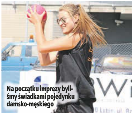
Na początku imprezy byliśmy świadkami pojedynku damsko-męskiego

– Trzeba przyznać nieskromnie, że chyba piłka ręczna cieszy się tutaj największym