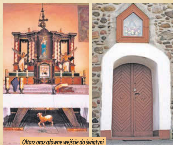
Ołtarz oraz główne wejście do świątyni