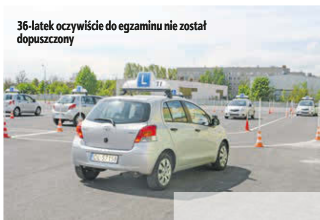
36-latek oczywiście do egzaminu nie został dopuszczony

nym powietrzu – mówi podinspektor Sławomir Masojć, oficer prasowy legnickiej policji. – To czwarty raz w tym roku, gdy jesteśmy wzywani do WORD-u, aby sprawdzić trzeźwość zdającego – dodaje. 36-latek oczywiście do egzaminu nie został dopuszczony. Wrócił do domu, ponieważ policja nie mogła go za-