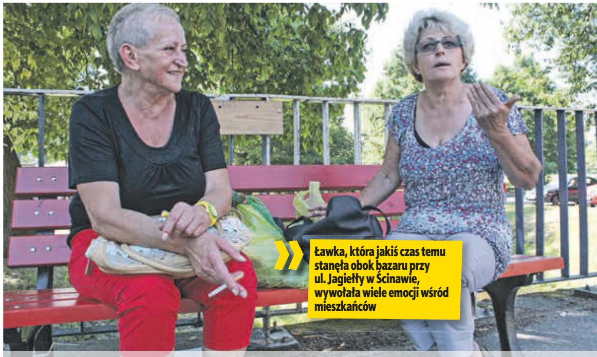
Ławka, która jakiś czas temu stała obok bazaru przy ul. Jagiełły w Ścinawie, wywołała wiele emocji wśród mieszkańców

– Burmistrz postanowił więc sprezentować im ławkę, identyczną jak w serialu „Ranczo”, porównując ich tym samym do pijaczków, którzy tylko siedzą i na wszystko narzekają. Podobno zrobił to nawet bez zgody starostwa, a przecież za gminne pieniądze – mówi nam jeden ze ścinawian.