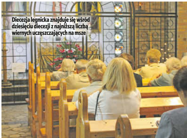
Diecezja legnicka znajduje się wśród dziesięciu diecezji z najniższą liczbą wiernych uczęszczających na msze

Liczenie wiernych odbyło się w polskich kościołach w październiku 2013 roku. Liczba uczestniczących wtedy w mszach wyniosła 39,1 proc. Po raz pierwszy od 1980 roku spadła poniżej 40 proc. Spadek dotyczy niemal wszystkich diecezji w Polsce. W ciągu ostatnich 10 lat grupa osób praktykujących regularnie zmniejszyła się o niemal 2 miliony osób!