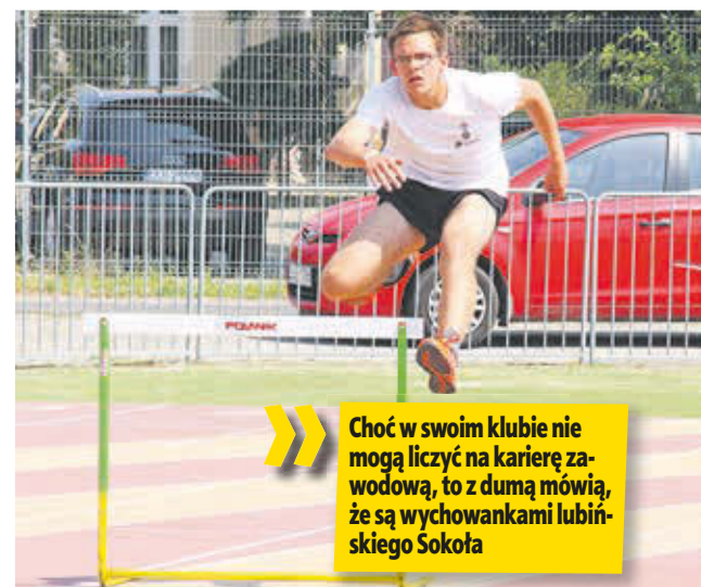
Choć w swoim klubie nie mogą liczyć na karierę zawodową, to z dumą mówią, że są wychowankami lubińskiego Sokoła

» Dzięki rodzicom i trenerom mogą spełniać swoje marzenia. Każdy sukces jest nie tylko zwycięstwem zawodniczki czy zawodnika, ale także osób, których nazwisk nie zobaczymy na tabeli w ogólnej klasyfikacji. Lekkoatleci MLKS Sokoła Lubin to utalentowani sportowcy, którzy z roku na rok straszą rywali nie tylko na polskich bieżniach, ale także zagranicznych. Niestety klub przy Zespole Szkół Sportowych ma coraz gorszą kondycję finansową i są obawy, że sukcesy lekkoatletów będą pojawiać się już tylko we wspomnieniach.