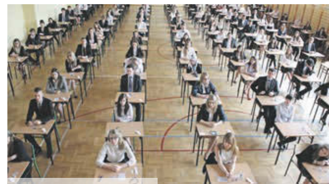
Do matury w powiecie lubińskim podeszło w tym roku łącznie 944 uczniów

Z 27 uczniów LP świadectwa dojrzałości otrzymało pięć osób, natomiast z czterech uczniów LU maturę zdała tylko jedna osoba. Wśród absolwentów techników z terenu naszego powiatu dokumenty na uczelnie wyższe może składać około 42 pro-