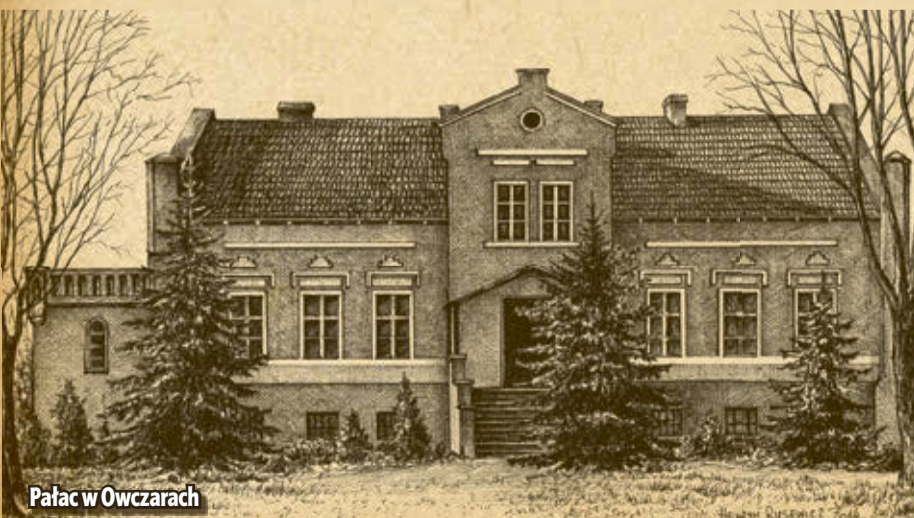
Pałac w Owczarach