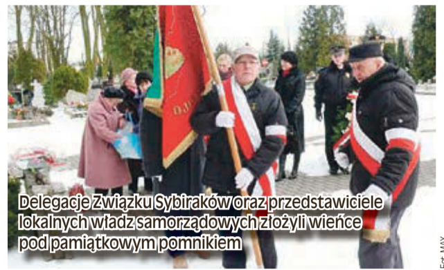
Delegacje Związku Sybiraków oraz przedstawiciele lokalnych władz samorządowych złożyli wieńce pod pamiątkowym pomnikiem