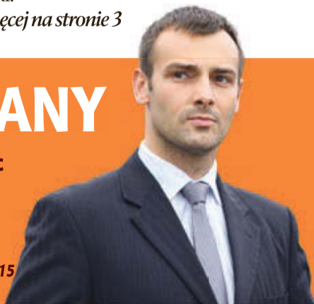
Fot. Marceina Falkiewicz