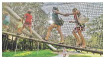
Fot. Tomasz Fotka