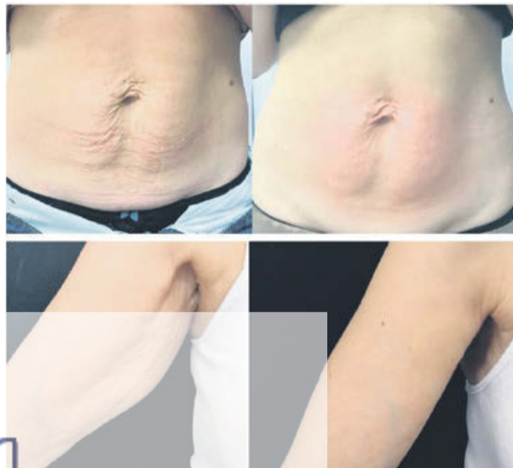
Zdjęcia przed i po zabiegu biodermogenezy

Zapraszamy do Medicus Uroda Clinica ul. Leśna 8, tel. 767282686