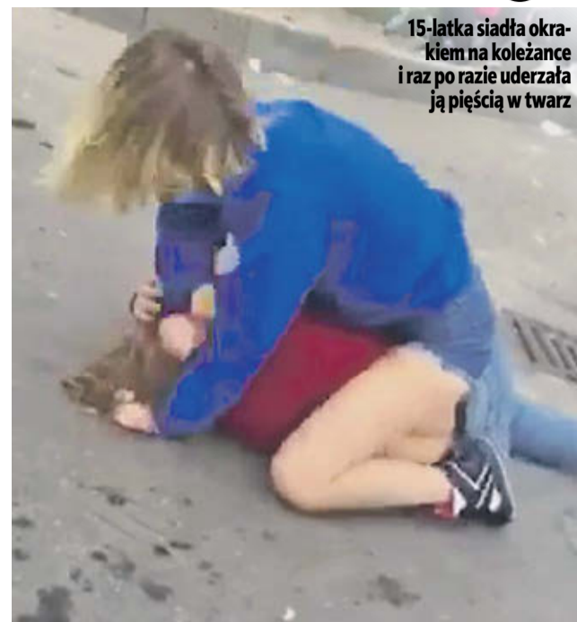
15-latka siedzi okrakiem na koleżance i raz po raz uderza ją pięścią w twarz

Już poniedziałkowego ranka uczniowie III LO spotkali się z nauczycielami w auli, by porozmawiać o piątkowym zdarzeniu, agresji i braku empatii wśród młodych. Młodzież ucząca się w ZS nr 1, której jest znacznie więcej, ta-