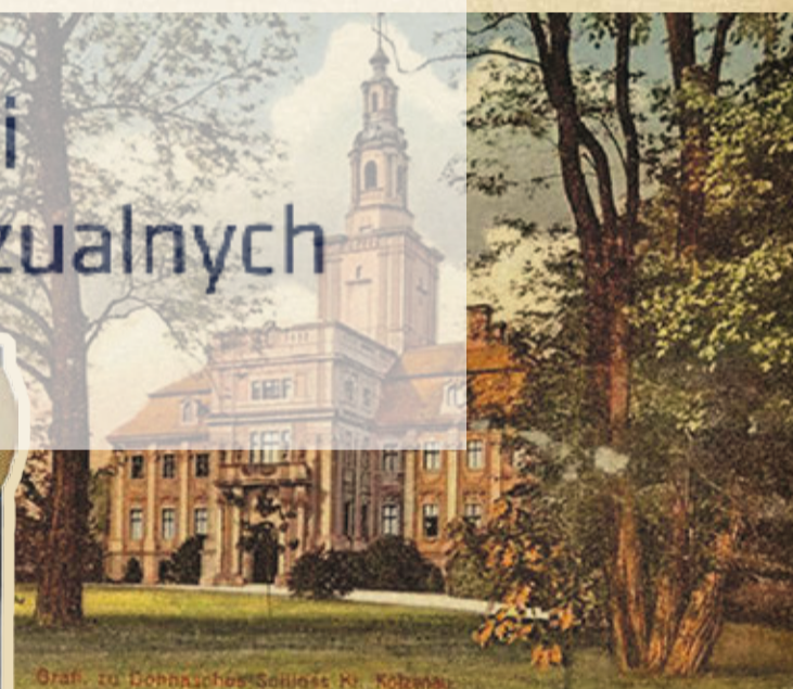
Pałac w Chocianowie na kolorowanej widokówce z końca XIX wieku

Nieodłącznym elementem długiej historii Chocianowa był i jest zamek. Po śmierci księcia legnickiego Henryka V Grubego w 1296 roku, opiekę nad jego małoletnimi synami przejął brat Henryka, książę świdnicko-jaworski, Bolko I Surowy. Po przejęciu w opiekę sukcesji legnickiej i wrocławskiej był on jednym z najpotężniejszych w tym czasie książąt śląskich. Był przy tym władcą mądrym i roztroptym, dbającym o rozwój gospodarczy swoich ziem, a także o ich bezpieczeństwo. Bolko I okazał się opiekunem lojalnym wobec swoich nieletnich bratanków. Nie tylko nie zagrabił żadnych terytoriów należących do synów Henryka, ale dzięki dobrej i rozsądnej gospodarce przysporzył im znacznych korzyści oraz dochodów, co w owych czasach należało raczej do wielkiej rzadkości.