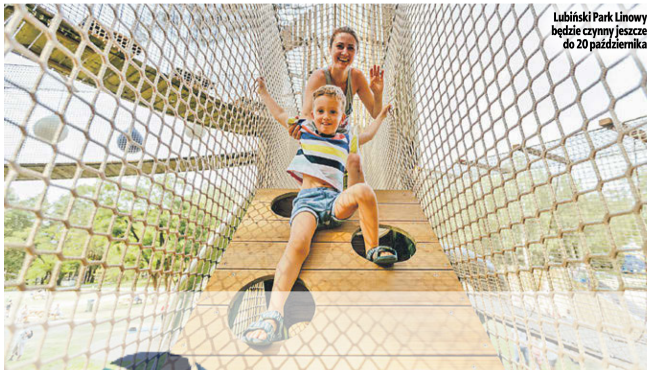
Lubiński Park Linowy będzie czynny jeszcze do 20 października