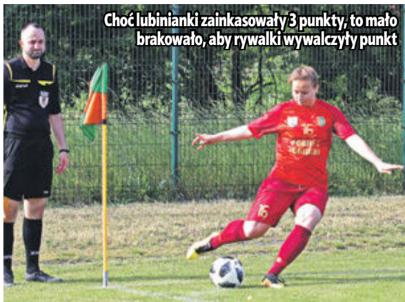
Choć lubinianki zainkasowały 3 punkty, to mało brakowało, aby rywalki wywalczyły punkt