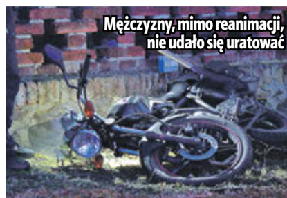
Mężczyzny, mimo reanimacji, nie udało się uratować

– Badamy w tej chwili okoliczności i przyczyny tego zdarzenia. Postępowanie dotyczy wypadku drogowego ze skutkiem śmiertelnym. Na chwilę obec-