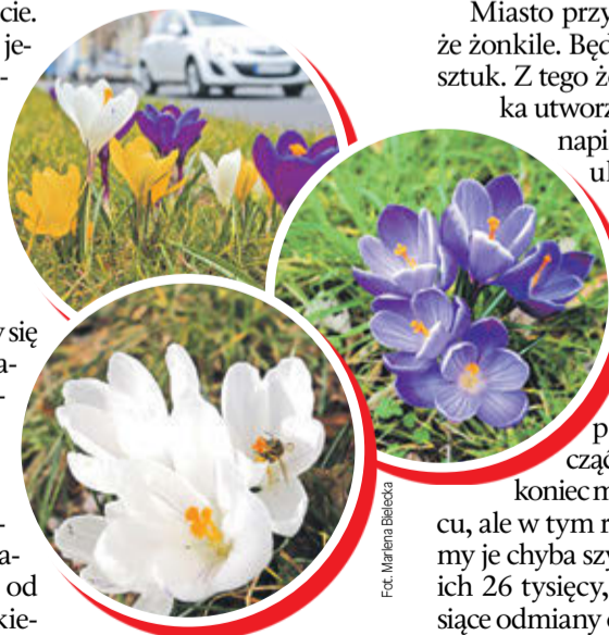
Pierwsze zakwitły krokusy. Można je zobaczyć na trawnikach wzdłuż głównych ulic

Jako pierwsze pojawiły się krokusy. Można je zobaczyć przeważnie na trawnikach przy drogach, między innymi przy drodze przy ulicy Paderewskiego, przy ulicy Kościuszki, a także przy Marii Skłodowskiej-Curie – od ronda przy Szkolnej w kierunku kombinatu. W sumie zasadzono 10 tysięcy cebulek tych kwiatów.