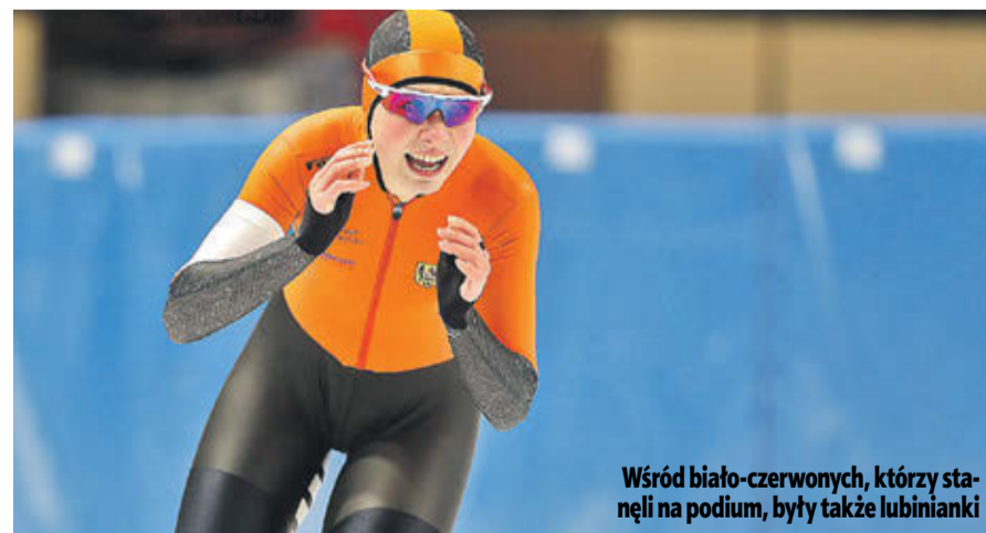
Wśród białoczerwonych, którzy stanęli na podium, byli także lubinianki

Poszukiwani pracownicy utrzymania czystości do sprzątnięcia obiektu wielkopowierzchniowego w Lubinie. Zainteresowane osoby prosimy o kontakt pod numerem 661 991 561