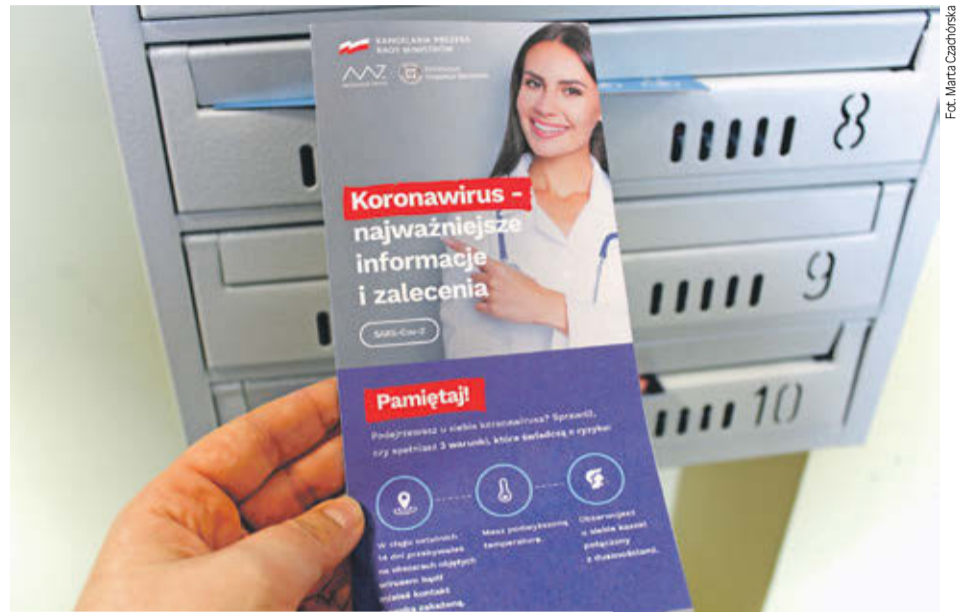
Do skrzynek lubinian trafiła też rządowa ulotka z informacjami, jak się ustrzec przed koronawirusem

Jak rozpoznać koronawirusa? Główny Inspektor Sanitarny ustalił trzy wa-