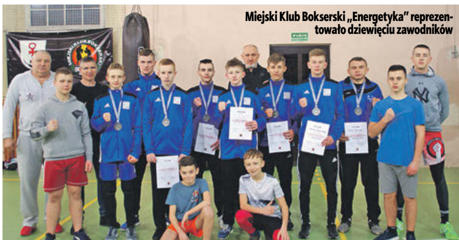
Miejski Klub Bokserski „Energetyka” reprezentowało dziewięciu zawodników