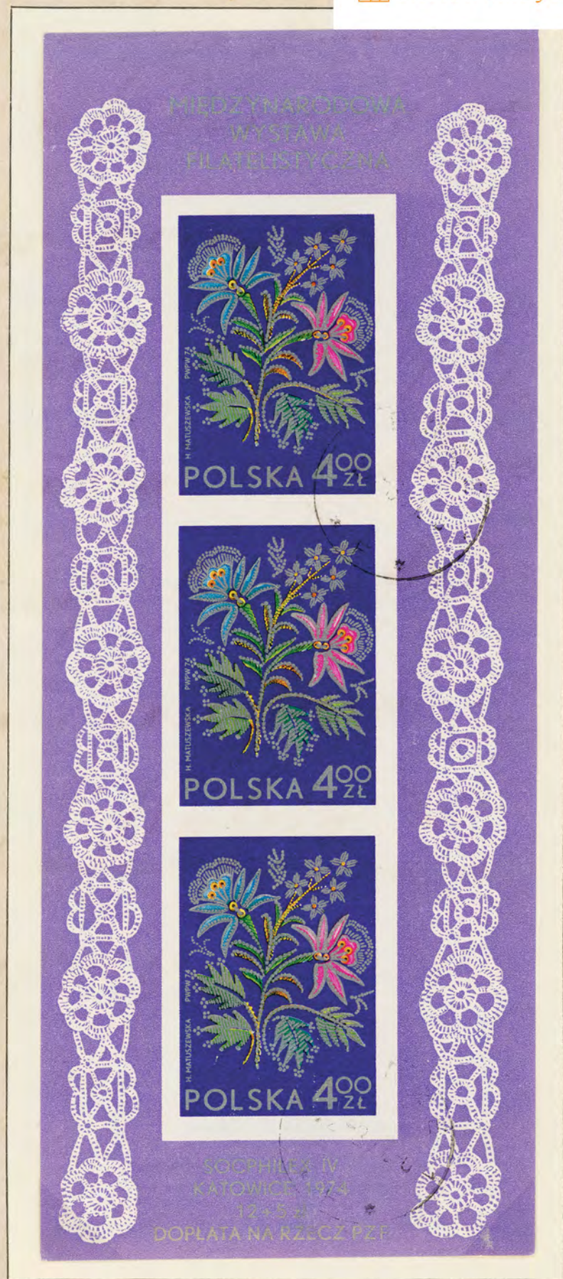
KWIATY NA ZNACZKACH POLSKICH