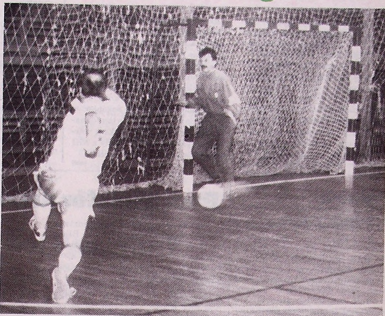
Mirosław Niechwiej (HM "Legnica") w ataku na bramkę wojskowych