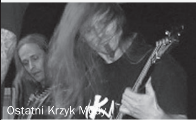
Ostatni Krzyk Mody