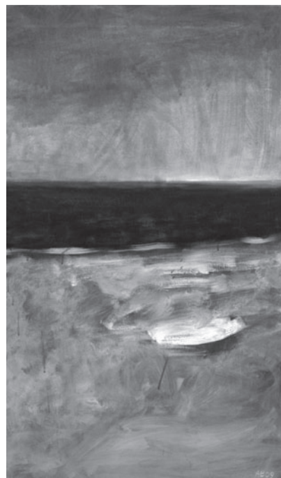
Andrzej Borkowski Widok z wydmy, olej/ płtno, 2009