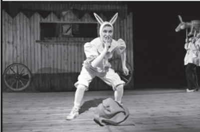
„Koci, koci łapci”

4 października rozpoczynamy cykl spektakli teatralnych dla dzieci. O godz. 14.00 i 16.00 będzie można zobaczyć „Koci, koci łapci” - spektakl Lubuskiego Teatru w Zielonej Górze.