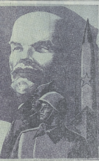
Воины нашей Группы в городском и лесном частях ведут суровую борьбу за мир и дружбу между народами.

Американский империализм был и остается духом и жаждой свободылюбивого народа. Жизнь, спокойствие и слава принадлежат врагу ленинского вождизма о том, что любая страна социализма — большая или малая — остро нуждается в защите от посягательств империалистических захватчиков. Выполняя заветы В. И. Ленина о защите социалистического Отечества, наша партия и народ неустойчиво укрепляют Советские Вооруженные Силы. Силой 51-го годовщины они выражают, как никогда, могучим и несокрушимым, в их боевом строю — Ратные воюла стратегического назначения, Сухотинцы воюла, Военно-Воздушные Силы, Войска противовоздушной обороны, Военно-Морской Флот, несущие боевую службу в защите нашей великой земли. Бойцы флота наших Вооруженных Сил — коммунисты, политически и физически закаленные и боевыми выносливыми, достойными выжить и бороться.