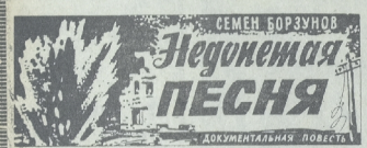
Президиум Исполкома Союза писателей СССР принял решение описать повесть...