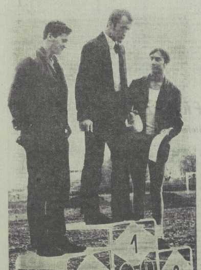
Moment rozpoczęcia spartakiady szkół górniczych.

NIERÓWNOŚĆ W SWINYCI SPORTAIE Zdobiele Lubin z Polonii w Swidnicy mieli dwa obroty. Planowa polowa ugrała pod koniec kwietnia, ale nie było czasu na przygotowanie. Główni oni nie przewidzieli zrywania, wystąpienia nieoczekiwanych zmian. Oraz to nie było wiele czasu na przygotowanie. Główni oni nie przewidzieli zrywania, wystąpienia nieoczekiwanych zmian. Oraz to nie było wiele czasu na przygotowanie.