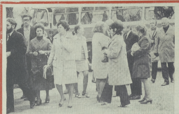
W Lubinie przebrnęli... (caption describing the group photo)