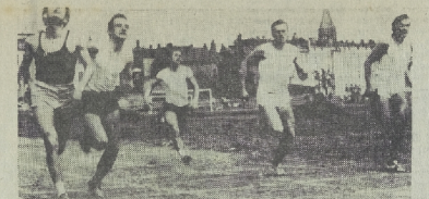
Moment rozpoczęcia spartakiady szkół górniczych.