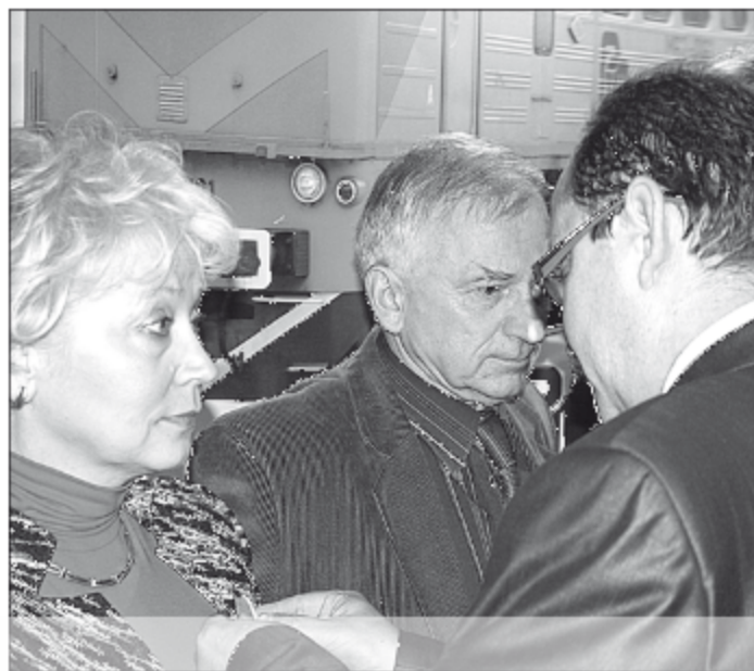
Wyróżniający się pracownicy spółki otrzymali Medale Za Długoletnią Służbę. Wicewojewoda wręczył również Złoty Krzyż Zasługi