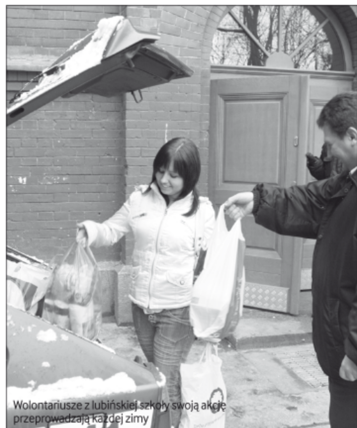
Wolontariusze z lubińskiej szkoły swoją akcją przeprowadzają każdej zimy