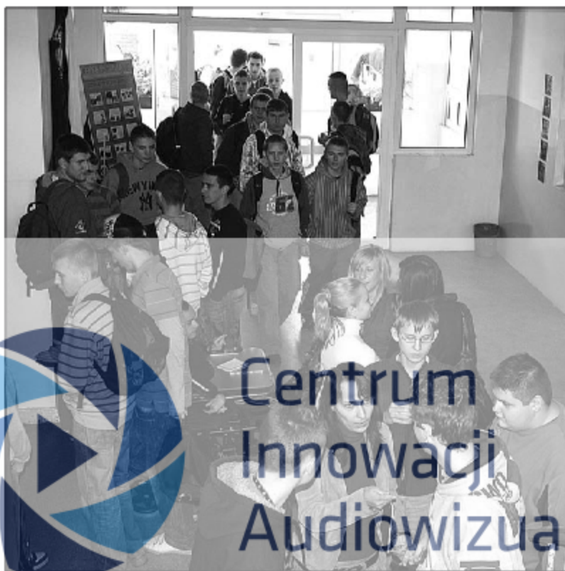
W tym roku po raz pierwszy możliwość przystąpienia do programu mają także gminy