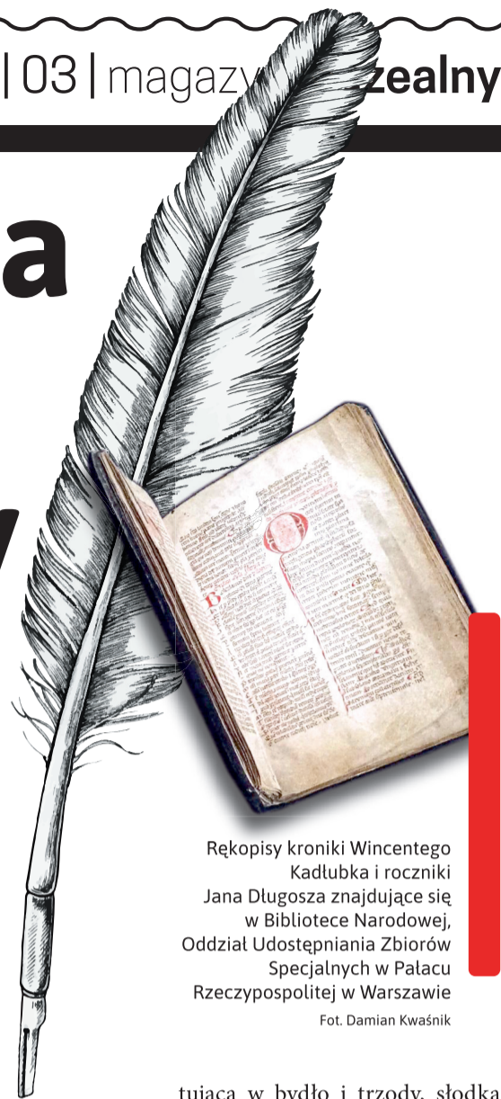
Rękopisy kroniki Wincentego Kadłubka i roczniki Jana Długosza znajdujące się w Bibliotece Narodowej, Oddział Udostępniania Zbiorów Specjalnych w Pałacu Rzeczypospolitej w Warszawie

Trzecim sławnym polskim kronikarzem był Jan Długosz herbu Wieniawa, duchowny, geograf, historyk, heraldyk, dyplomata i wychowawca synów króla Kazimierza IV Jagiellończyka. W przedchrześcijańskiej historii Polski, Długosz w dziele pt. „Roczniki, czyli kroniki sławnego Królestwa Polskiego” odnosił się do legend i tradycji przekazanych przez wcześniejszych autorów. Wywodzi pochodzenie Polaków od jednego z siedmiu synów Jafeta, syna Noego. Przekazuje opowieść o Lechu i jego młodszym bracie Czechu, jednak jego wersja ma na celu wyjaśnienie politycznego powstania narodów, a nie dokładne odwzorowanie legendy. Niemniej kronikarz szczegółowo opisuje kraj, w którym zamieszkał Lech. Podaje wiele nazw geograficznych. Ziemię polską opisuje jako „urodzajną w zboże, o owocach uroczych, rybach wyborych, nabiale smacznym, sławną z łowów, obfi-