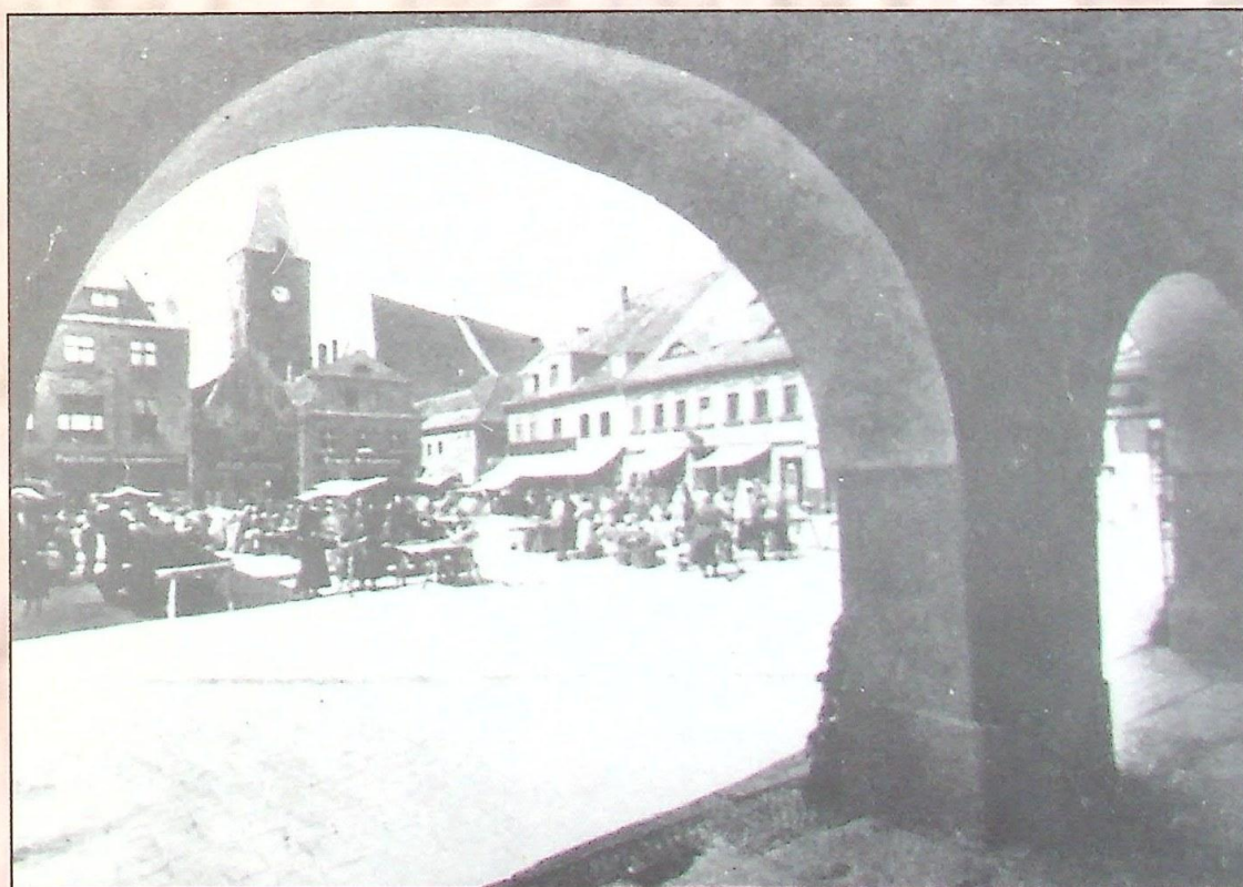
Oto kolejne dwa zdjęcia przedwojennego Lubina.