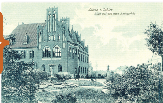
► Nieistniejący budynek Sądu Rejonowego w Lubinie (pocztówka z 1913 r.)

Wystawa poświęcona lokalnej historii zostanie udostępniona na lubińskim rynku.