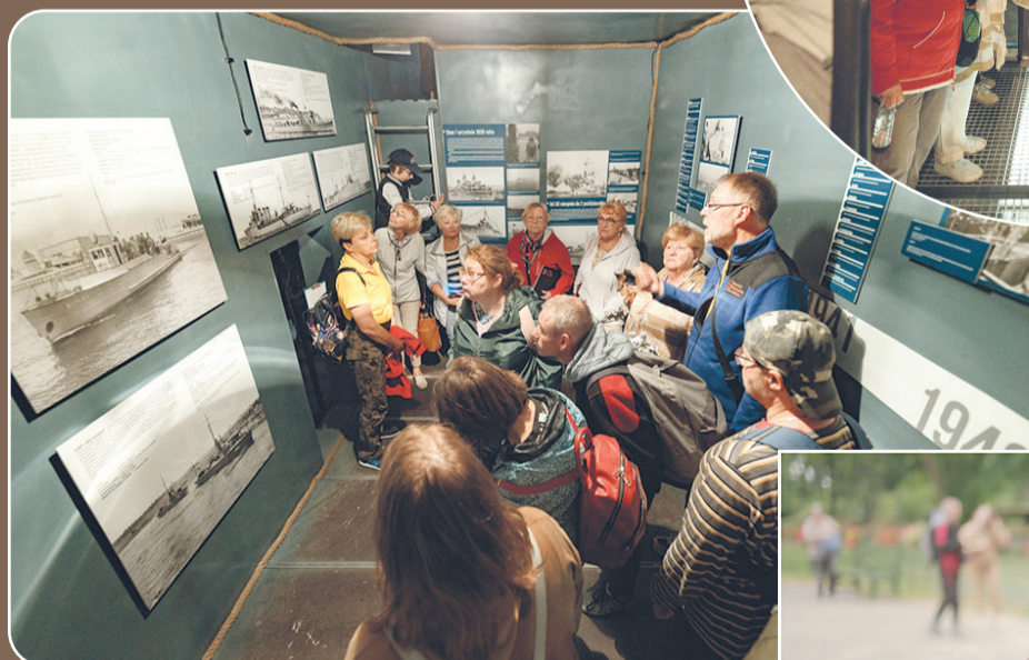
► Na zdjęciu powyżej grupa uczestników podczas zwiedzania wystawy ORP „Orzeł” nie powrócił