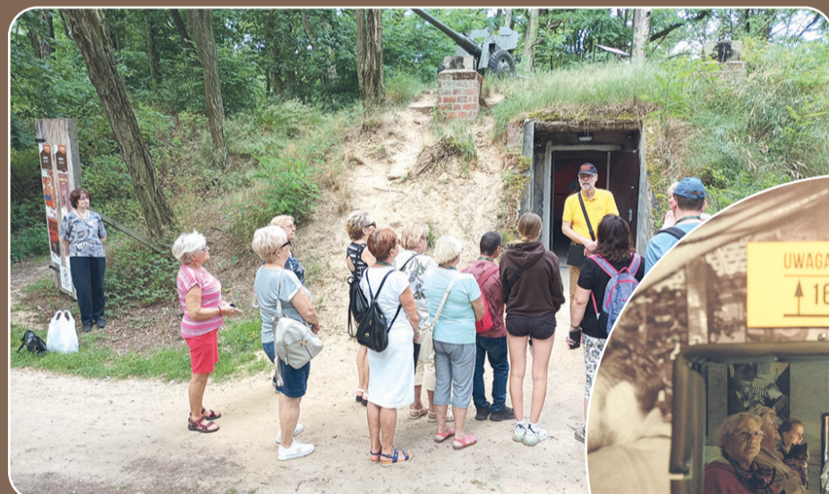
► Zwiedzanie wystaw w bunkrach Parku Leśnego

Projekt dedykowany jest głównie seniorom, lecz zapraszamy również wszystkie grupy wiekowe do wspólnej podróży w przeszłość. Przybywajcie całymi rodzinami na spotkanie z żywą lekcją historii w nieco innym wydaniu. Międzypokoleniowa współpraca pozwoli na zachowanie pamięci o ważnych wydarzeniach historycznych poprzez przekazywanie wiadomości i wspomnień.