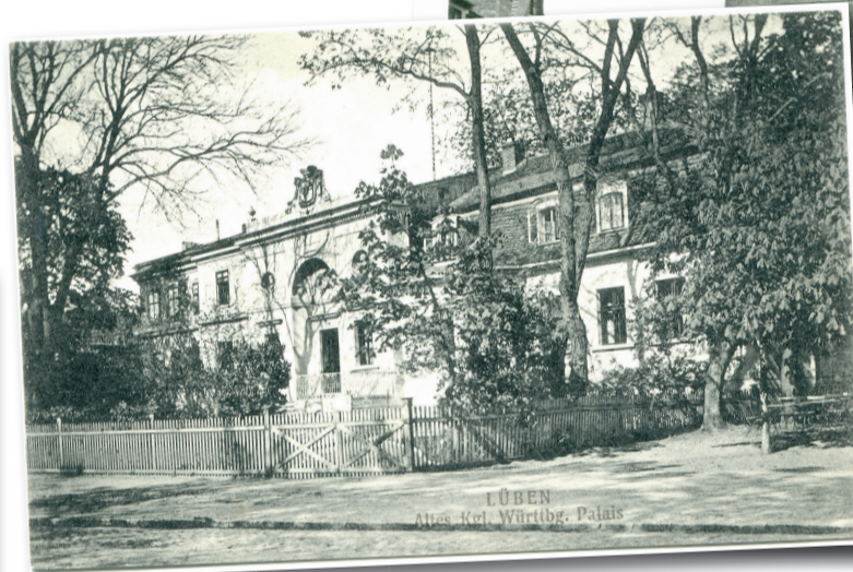
► Nieistniejący pałac księcia Wilhelma I Wirtemberskiego (pocztówka z 1910 r.)