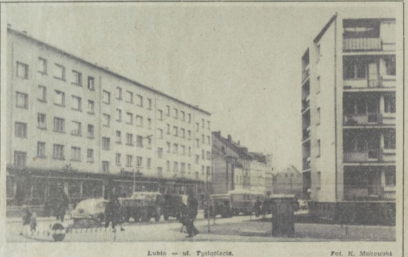
Lubin — ul. Żywiecka.