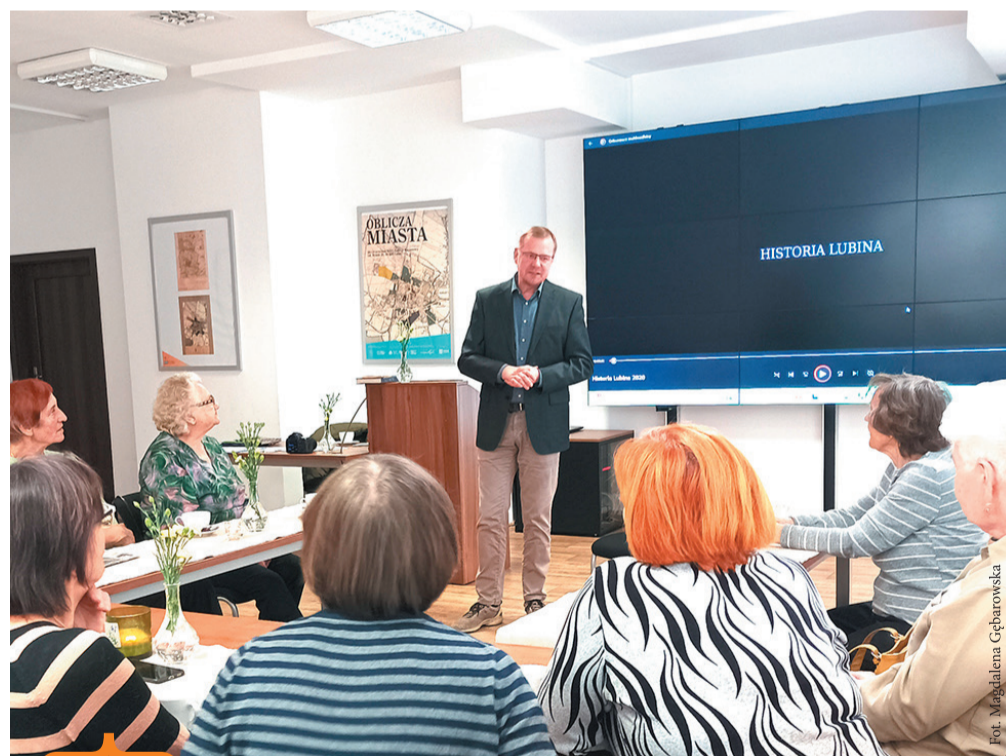
„Klub wspomnień, czyli Lubin sprzed lat” – spotkanie w ramach projektu „Dojrzałe Wspaniali”