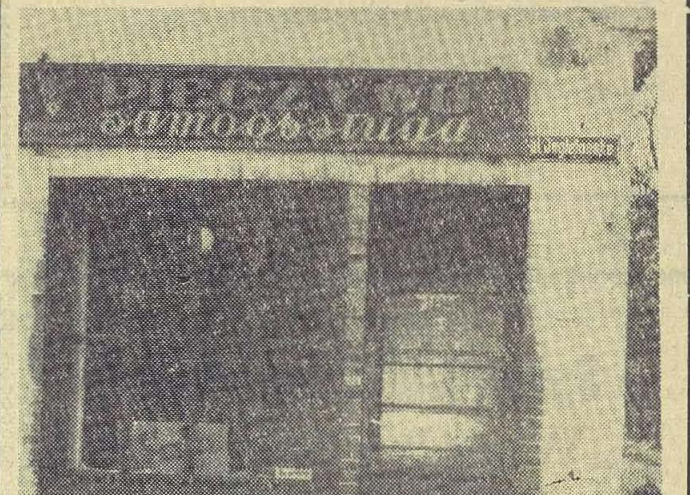
Pierwszy „Sam” w Prochowicach, otworzyła miejscowa GS.