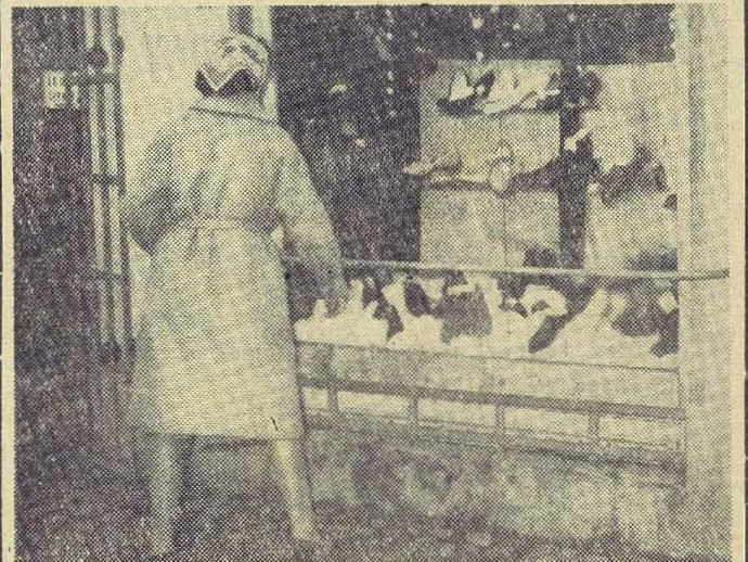
Jeszcze tylko rzut oka na wystawę, a następnie do sklepu. Ładny bucik zdobi nóżkę! – O tym panie dobrze wiedzą.