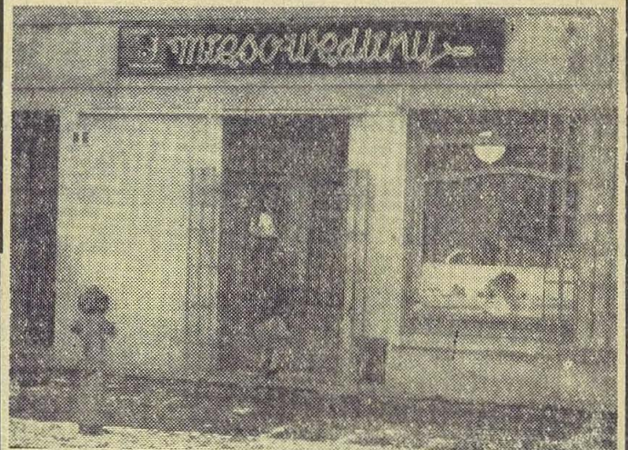
Ładny szyld zaprasza do wnętrza! Na zdjęciu sklep GS w Prochowicach.